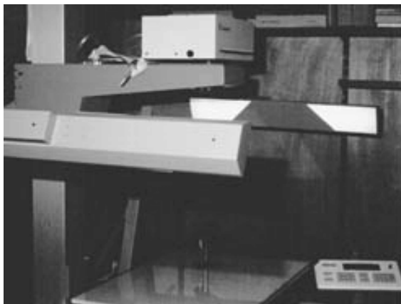
Microfilmkamera OK 301 von Zeutschel

Auch als Teil eines integrierten Lieferdienstes für Dokumente aller Art und in jeder Qualität wird das konkurrenzlos preisgünstige Angebot an analogen Mikroformen zweifellos seinen Platz behaupten. Für die Benutzer können auch sehr lange Texte übersichtlich und günstig reproduziert werden, während die Bibliothek vor allem unter dem Gesichtspunkt des Schutzes von Originalen die erwiesene Langlebigkeit des Mediums schätzt.