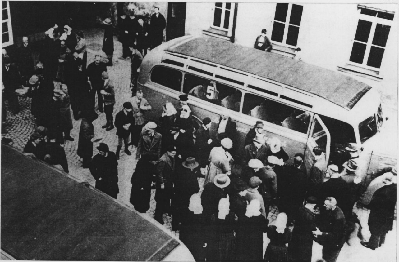
Psychisch Kranke und Behinderte wurden mit grauen Bussen zur Vernichtung nach Grafeneck gebracht.