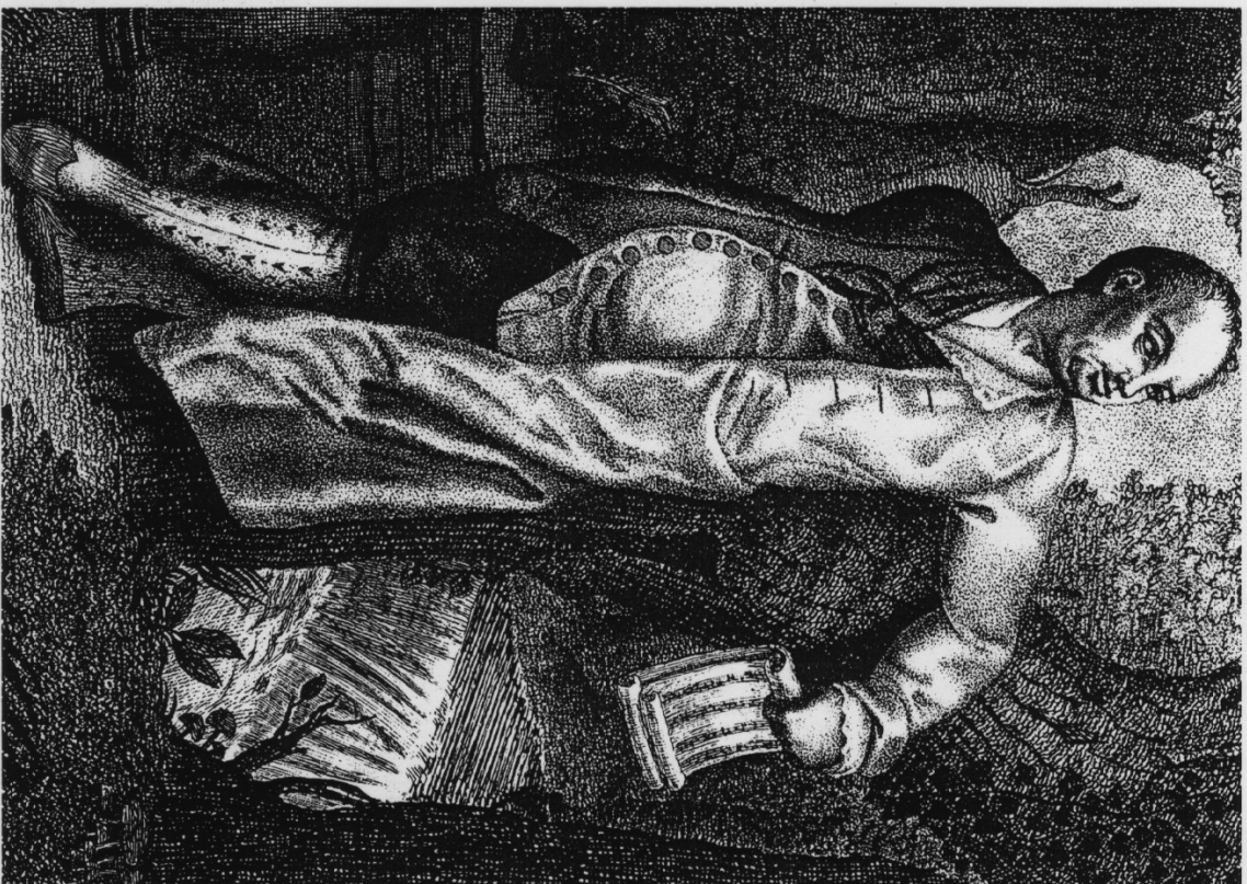
Ein Holzschnitt des Komponisten Niccolò Jommelli, der am Stuttgarter Hoftheater wirkte

Die Ausstellung ist bis zum 22. Dezember geöffnet. Montag bis Freitag von 8 bis 20 Uhr, Samstag von 9 bis 13 Uhr. An Sonn- und Feiertagen geschlossen. Der Eintritt ist frei. Weitere Informationen unter www.wlb-stuttgart.de (Musiksammlung)