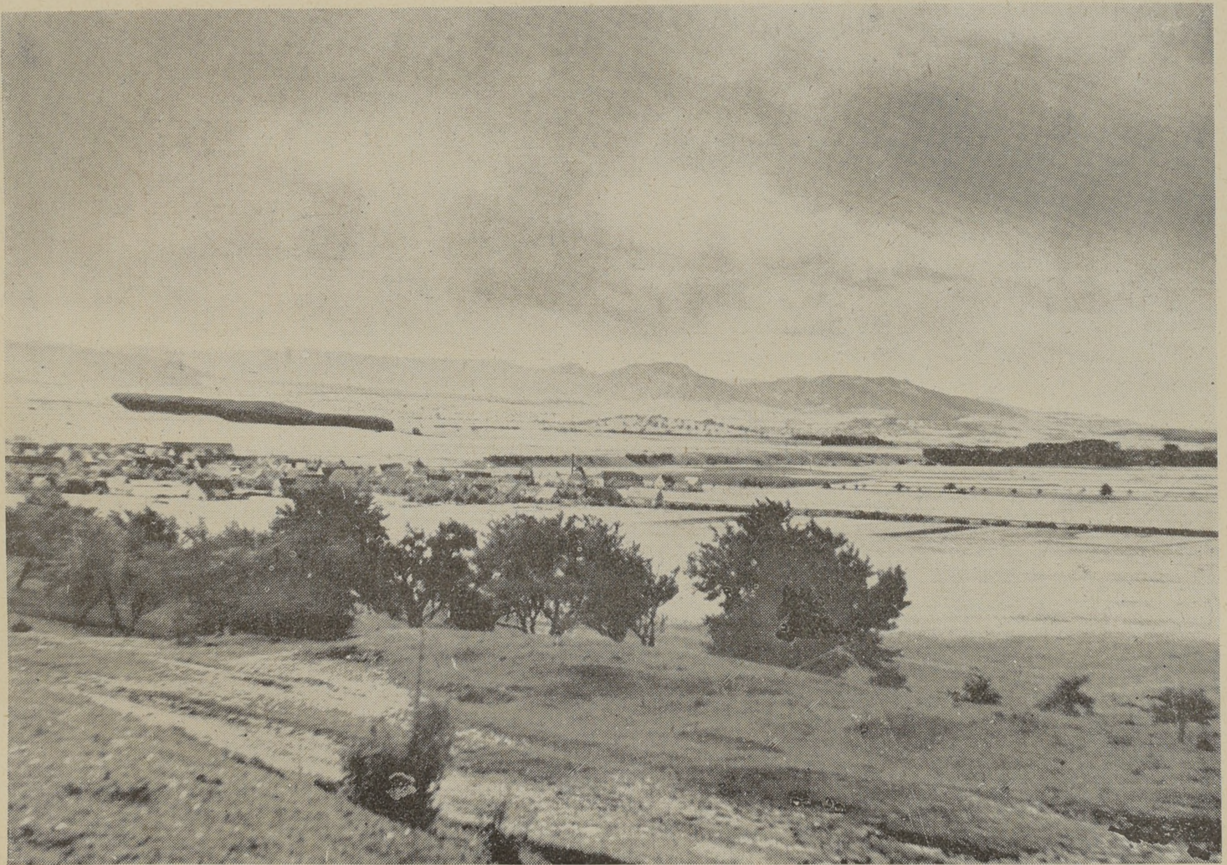
Blick auf Grosselfingen

Cooper, F.: Lebensbilder aus Frankreich, den Rheinländern und der Schweiz (1837, 2 Bde.) (Reiseschilderung von Hechingen).