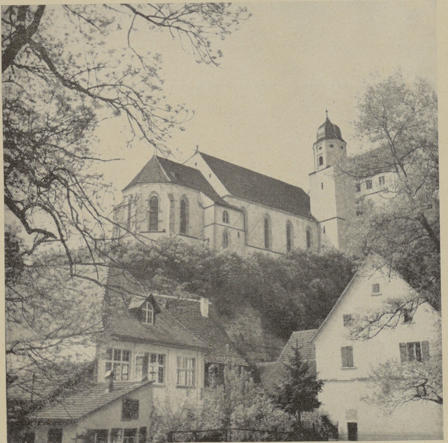
Haigerloch im Kranze des blühenden Flieders

An dem nun festgelegten Aufbau des Vereins (vgl. „Jhft. 1936“, S. V/VI) ist nichts Wesentliches mehr geändert worden. Eines meiner letzten organisatorischen Ziele, die Schaffung einer Arbeitsgemeinschaft