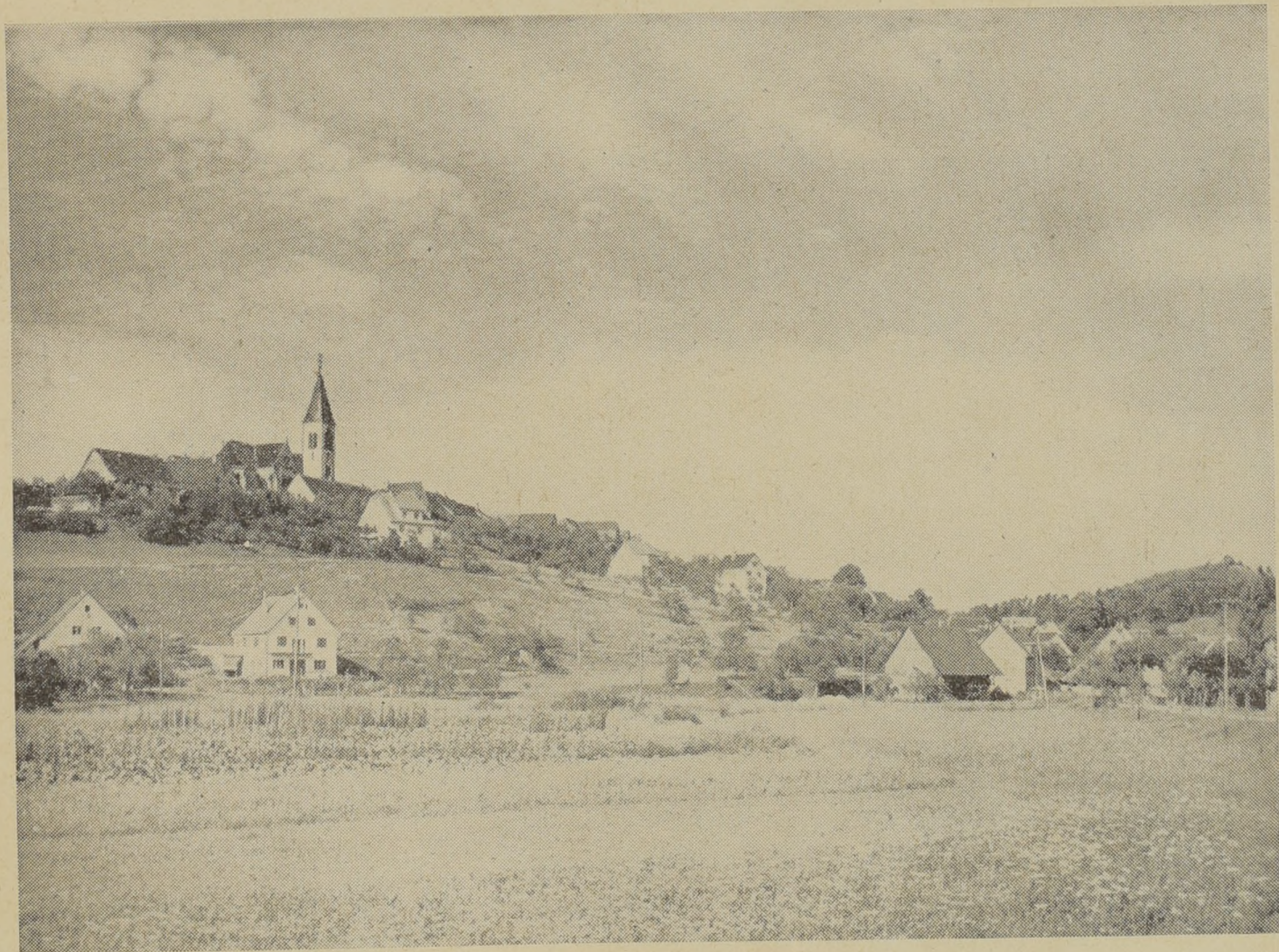
Stetten bei Haigerloch

5) Auf das erste Sturmzeichen versammeln sich die Rottmeister mit ihren Gehilfen, und die ganze Mannschaft mit ihren Feuer-Eymern versehen, vor dem Rathause. Dort wird die Rotte vor ihren Rottmeister gestellt, und dann nebst der dazu gehörigen Spritze in guter Ordnung zu der Brandstelle geführt.