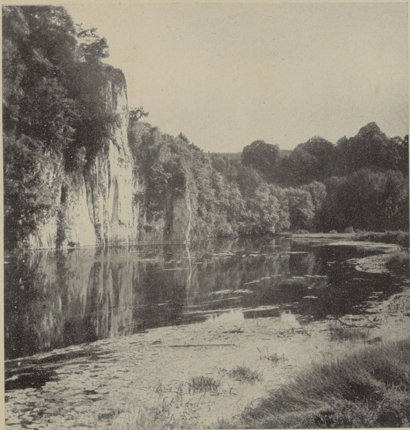
Im romantischen stillen Tal der Donau

in dem feuerwesen“ zu haben. In manchen Jahren kam die Feuerordnung zweimal zur Verlesung. Nicht selten kam auch vor, daß die Rotten fühlbare Lücken aufwiesen, besonders, wenn die Hechinger nach auswärts gerufen wurden. Am 14. März 1765 wurden 20 Mann, die beim Brand in Rottenburg nicht „Sturm geloffen“ sind, mit je 15 Kreuzern bestraft. Gleichzeitig wird beschlossen, künftighin alle, die beim „Sturmschlagen“ nicht vor dem Rathaus erscheinen, mit 1 Gulden zu bestrafen. Am 20. Juli 1775 ist „bey der sub hodierno Publicierten feyordnung“ Joseph Vitalowitsch und Consorten, 18 an der Zahl, nicht erschienen. Ein jeder hatte zur Buße 6 Kreuzer zu erlegen. Im Jahre 1780 wurde für jene, die beim Verlesen der Feuerordnung fehlten, eine Strafe von 10 Kreuzern angesetzt. Unter dem 21. Dezember 1781 wird berichtet, wie den Inspektoren der Feuerspritze nachdrücklichst aufgetragen wurde, jederzeit den angewiesenen Posten selbst zu versehen und nicht andere zu bestellen. Vor allem aber sollen sie darauf achten, „daß