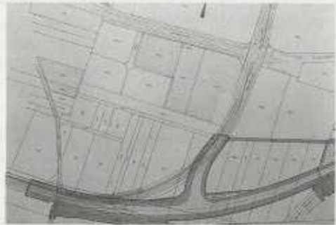
Abb. 2: Güglingen, Gewerbegebiet „Ochsenwiesen-Steinäcker“ mit Grabungsflächen

Während der Erschließungsarbeiten und durch den überraschenden Verkauf von zwei großen Grundstücken mußten im Frühjahr 1999 und von August bis Oktober 1999 zwei Notgrabungen durchgeführt werden, deren Ergebnisse hier vorgestellt werden (Abb. 2). Zum besseren Verständnis zunächst aber ein kurzer Blick auf die geschichtliche Situation in Südwestdeutschland im 2. und 3. Jahrhundert n. Chr..