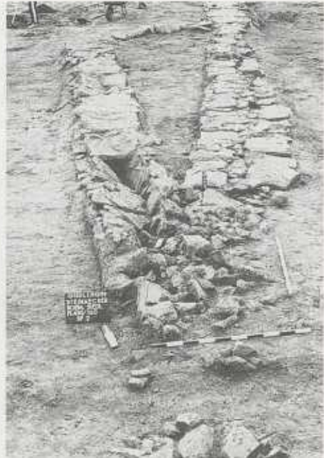
Abb. 4: Güglingen, Entwässerungskanäle und Drainagen