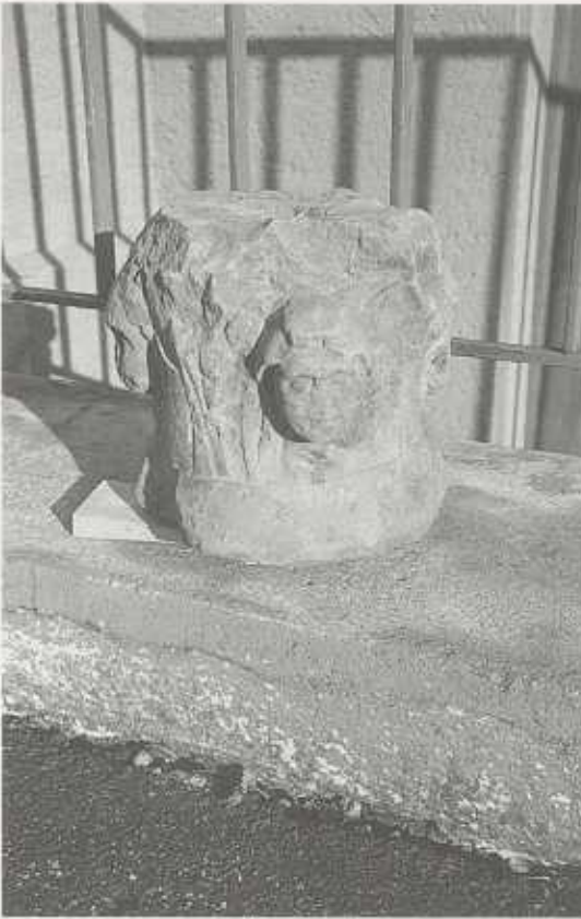
Abb. 8: Güglingen, Kapitell einer Jupiter-gigantensäule