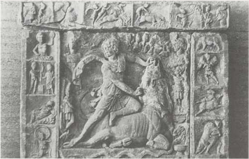
Abb. 7: Heidelberg-Neuenheim, Kultbild des Mithras