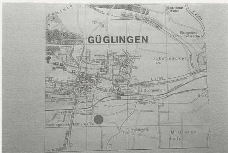
Abb. 1: Plan der Stadt Güglingen mit Lage des Grabungsgebiets

Nach diesen Aufzeichnungen und Kartierungen ist die römische Siedlung außerordentlich groß. Auf Luftbildern sind ein stattliches Gebäude und ver-