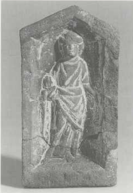
Abb. 3: Güglingen, Flachrelief aus Schilfsandstein mit einer Götterdarstellung