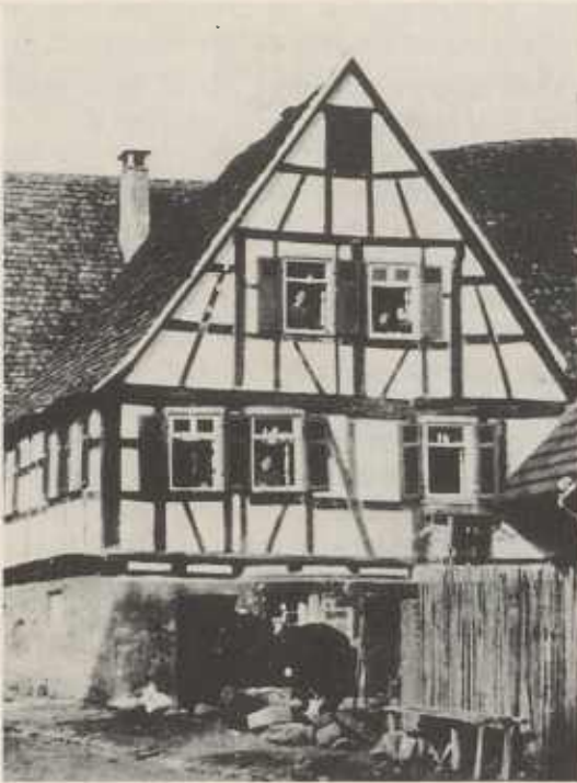
Das alte Rathaus, Ort der Weiberzeche von 1753–1821

Jahr 1750 die Ratsstube ausbrechen und diese ins neue, von Christoph Brenzingers Witwe 1747 erkaufte Rathaus übernehmen. In der Folge hat man das Kelterhäuschen verkommen lassen. Ein Gesuch der Gemeinde um Abbruch desselben wurde von der Regierung am 6. 2. 1805 abschlägig beschieden und der Gemeinde die Wiederherstellung „in einen brauchbaren Stand und die fürhin gehörige Unterhaltung“ befohlen.