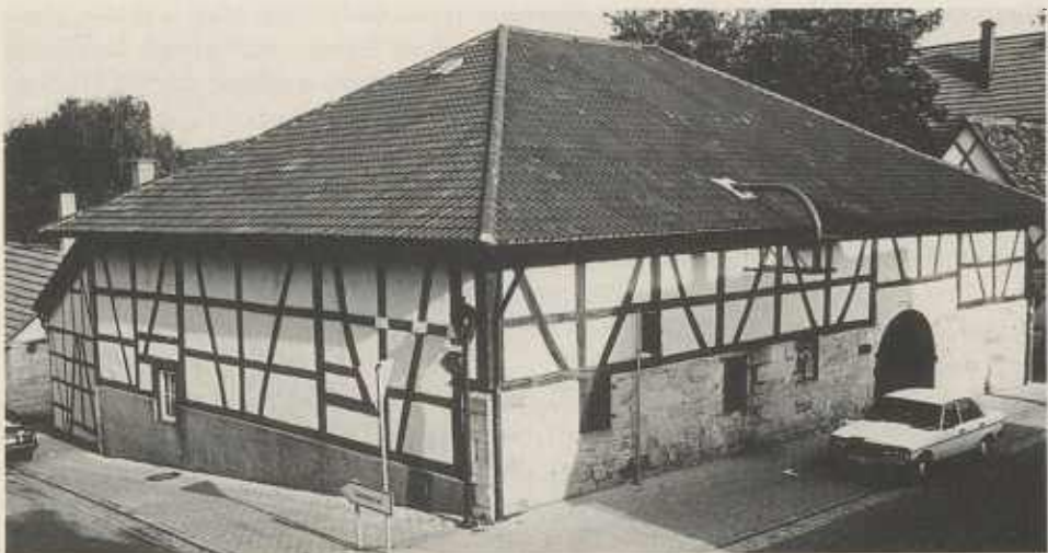
Die Kelter, in deren Ratsstube die Weiberzeche bis 1746 abgehalten wurde