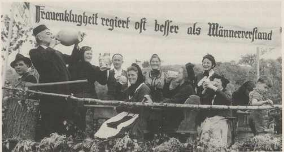
Festwagen „Weiberzeche“ beim Turnfest am 27. – 29. 6. 1958 in Ochsenbach

Alles in allem ist das Vorgesagte kein Beweis für einen fastnachtlichen Ursprung. Wenn eine regelmäßige Zusammenkunft zum Zwecke des gemeinsamen Weintrinkens in der Fastnachtszeit stattfindet, muß es sich nicht schon deshalb um einen Fastnachtsbrauch handeln. Bereits in der Zeit der Aufklärung wurde versucht, Volksfesten und Bräuchen einen historischen Sinn zu unterlegen um den Grund für die weitere Abhaltung zu schaffen. 121 Noch klarer wurde dies in der Zeit des Nationalsozialismus, als nur noch Fastnachten abgehalten werden durften, die durch ihr hohes Alter und eine Deutung im Sinne ger-