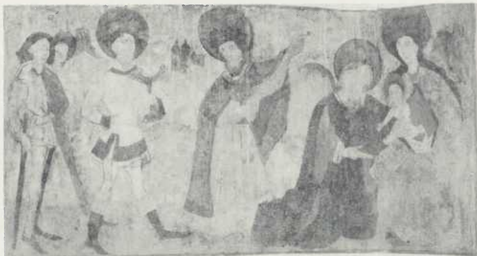
Abb. 12 Die Heiligen Drei Könige beten das Kind an; Nordwand. Nach der Restaurierung.