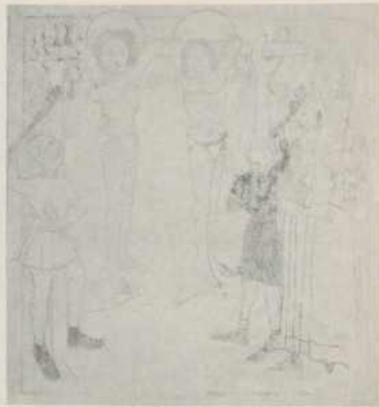
Abb. 7 Die beiden Heiligen werden mit Knüppeln geschlagen; Nordwand. Nach der Restaurierung.