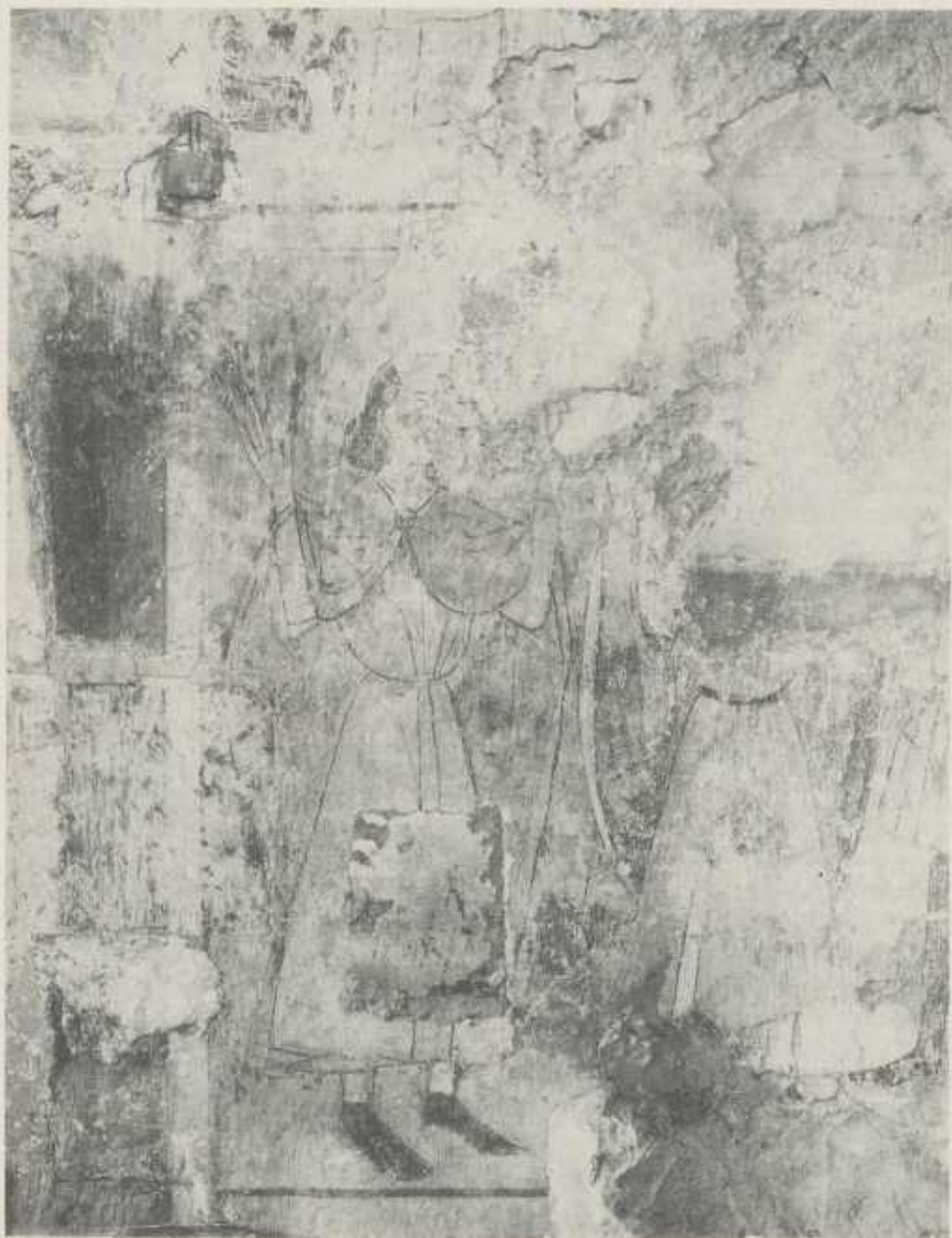
Abb. 9 Crispinus und Crispinianus werden Ahlen unter die Fingernägel getrieben; Nordwand. Aufnahme aus dem Jahre 1914; Ausschnitt.