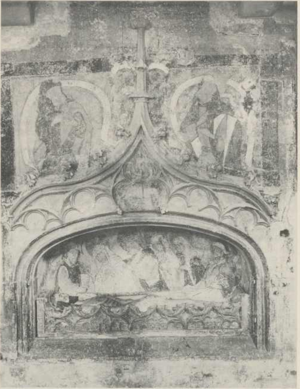
Abb. 1 Heilig-Grab-Nische; Nordwand. Aufnahme aus dem Jahre 1914 unmittelbar nach Entdeckung der Nische.