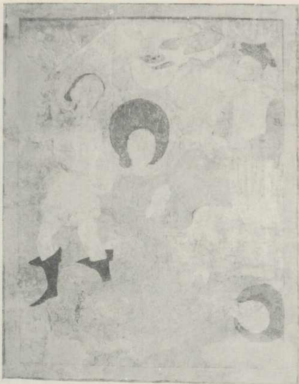
Abb. 11 Enthauptung der beiden Heiligen Crispinus und Crispinianus; Nordwand. Nach der Restaurierung.