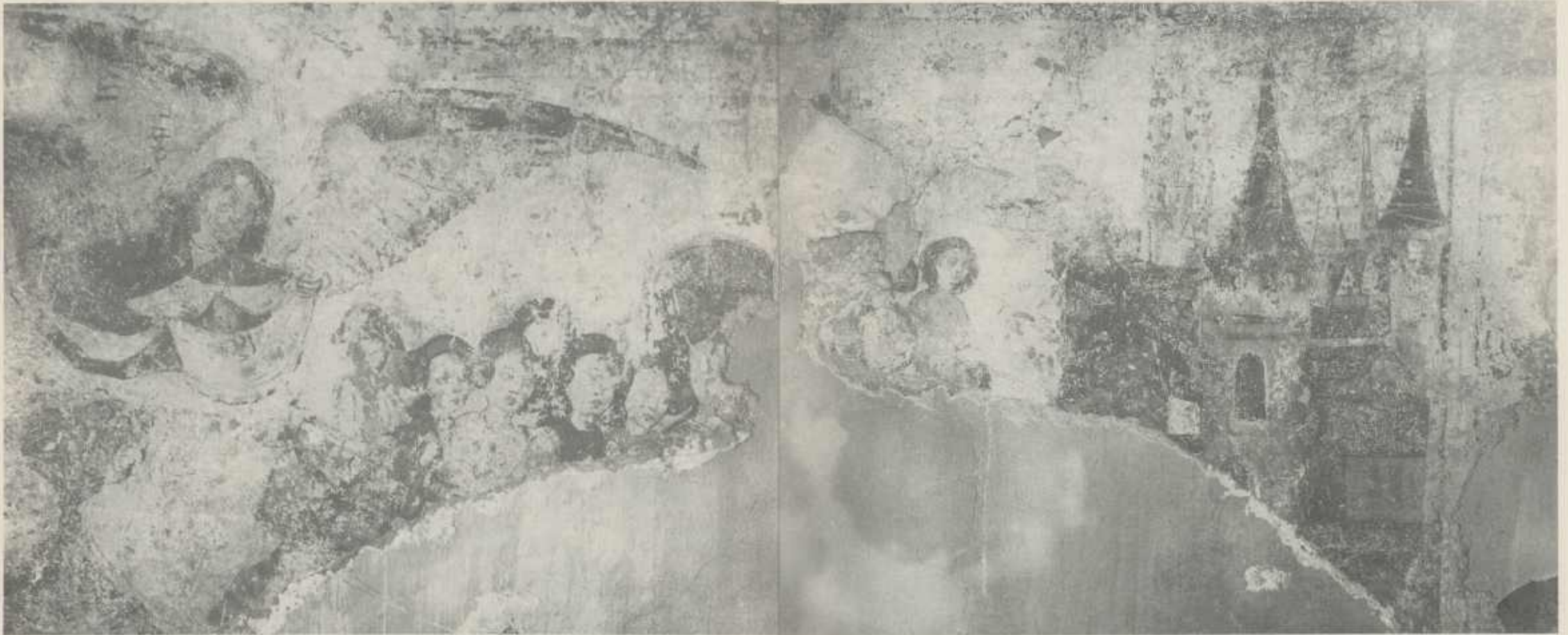
Abb. 2+3 Martyrium der Heiligen Ursula und ihrer 11000 Jungfrauen vor Köln; Südwand. Aufnahme aus dem Jahre 1914.

Aschenresten zufolge scheint er einem Brand zum Opfer gefallen zu sein 19 ). Es ist anzunehmen, daß dieser Bau um 1100 im Zuge der ersten großen Jakobusverehrung errichtet worden ist 20 ).