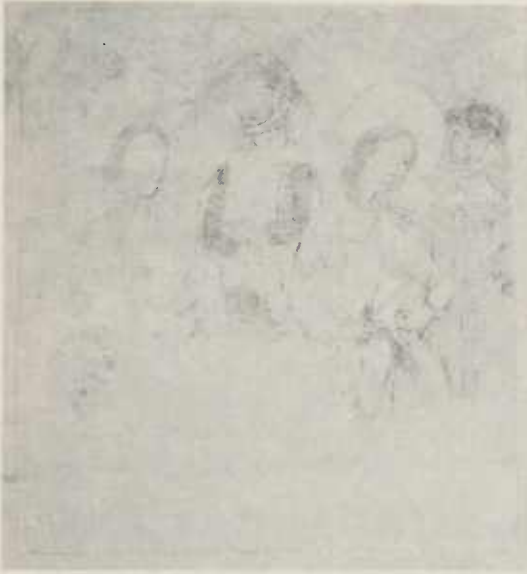
Abb. 6 Crispinus und Crispinianus werden in ihrer Werkstatt verhaftet; Nordwand. Nach der Restaurierung.