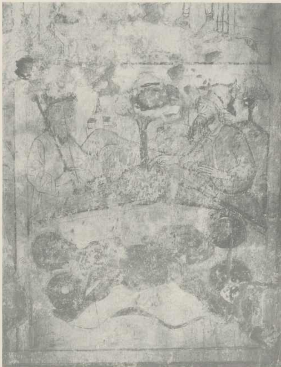
Abb. 10 Die beiden Heiligen werden mit Mühlsteinen um den Hals in die Aisne gestürzt; Nordwand. Aufnahme aus dem Jahre 1914.