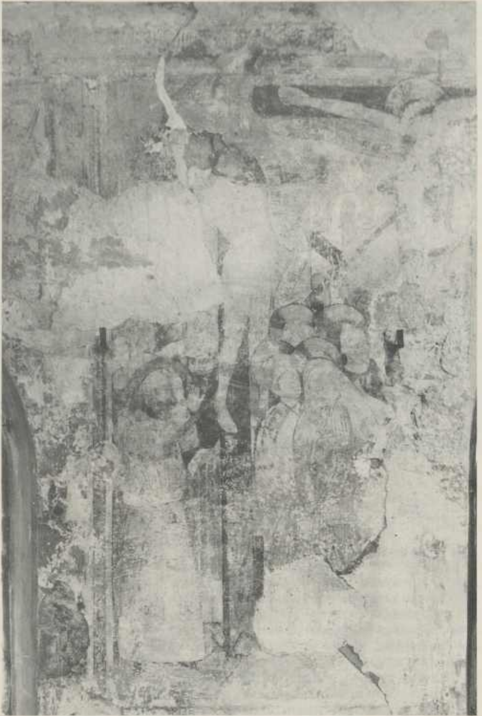
Abb. 4 Kreuzigung Christi; Südwand. Aufnahme aus dem Jahre 1914.