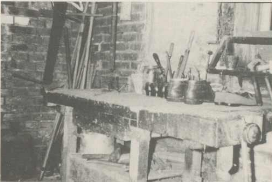
Hobelbank im früheren alten Stall im Haus Dorfstraße 61 im Jahr 1973