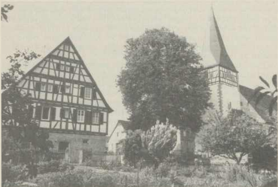
Pfarrhaus und Kirche in Pfaffenhofen vom Pfarrgarten aus gesehen. Im Hintergrund das alte Schulhaus. Es steht an der Stelle des 1897 abgebrochenen älteren Schulhauses, in dem Richter gewirkt hat.

Bei all diesen Fällen, wie sie uns Richter in präziser Schrift und in präziser Formulierung niedergeschrieben hat, hält er sich auffallend zurück. Keine persönlichen Bemerkungen und Stellungnahmen fließen in die Protokolle ein. Es scheint, als hätte er in der Konventsarbeit kaum initiativ eingegriffen. Nur bei einigen Dingen spürt man sein Engagement. Das sind vor allem alle schulischen Dinge, die eindeutig Präferenz für ihn haben, hier verspürt man starke Anteilnahme, und: wenn es darum ging, sich für Schwächere stark zu machen, z.B. den Lehrgehilfen bessere Lebens- und Arbeitsbedingungen zu schaffen. Oder im Falle eines taubstummen Mädchens, für das er die Übernahme der Kosten zur Fortbildung in einer Taubstummenanstalt fordert und sich mit seiner entscheidenden Stimme gegen die