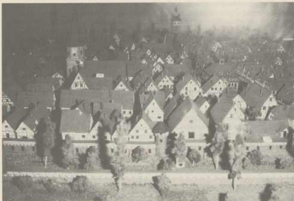
Ausschnitte aus dem Modell „Brackenheim vor 1800“ von Helmut Apelt. Blick von Norden (oben) und Blick von Süden mit Wassergraben am rechten Bildrand (unten). Zerstört wurde 1691 der Teil nördlich der Quergasse.