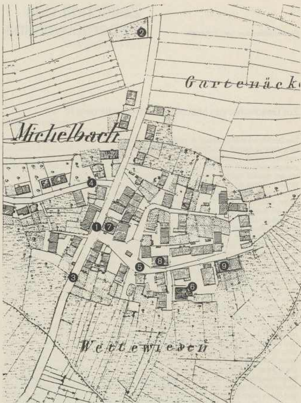
Ausschnitt aus der Michelbacher Flurkarte 19. Jahrhundert