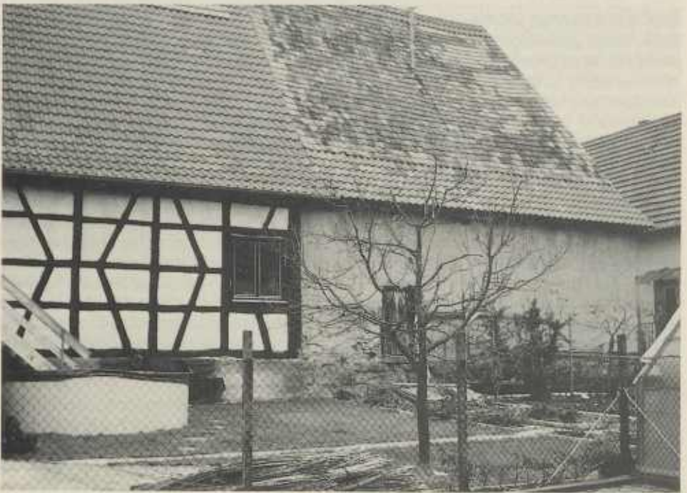
Zehntscheuer in Michelbach a. H.

Die beiden Brüder verkauften 1749 ihre Herrschaft mit den vier Dörfern Ochsenburg, Leonbronn, Zaberfeld und Michelbach an Herzog Karl Eugen von Württemberg, dem daran gelegen war, eine Abrundung Württembergs zu erreichen mit einer Ausgangsbasis für die Erweiterung des Landes gegen die Pfalz hin. Damit fiel 1749 das ganze Sternenfels'sche Lehen an Württemberg zurück. Nur das Begräbnisrecht in Michelbach behielten sich die Herren von Sternenfels vor, doch wurde später davon kein Gebrauch gemacht.