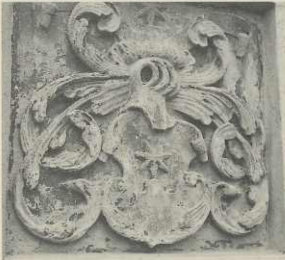
Sternenfelser Wappen am „Alten Schlöble“ in Michelbach a. H.