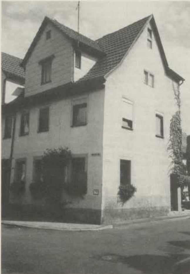
Anwesen Bürgerturmstraße 1 in Brackenheim

Die Papierqualität ist noch als gut zu bezeichnen, die Siebstruktur ist erkennbar, Fraßschäden haben Schäden hinterlassen.