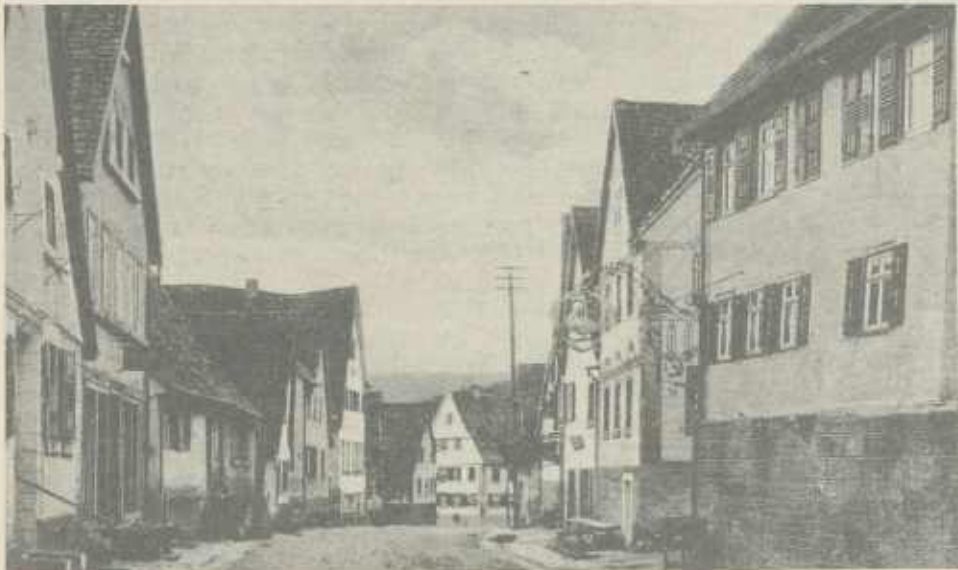
Die Hauptstraße in Zaberfeld um 1900 mit den Gastwirtschaften zum Schwanen (rechts) und zur Krone (hinten links)

Im Jahr 1573 gab es am Ort 62 Häuser: 41 Lehenshäuser, 3 Mühlen und 18 Häuser, die, ohne zur ersten Gruppe zu zählen, doch zu einer Geldabgabe (12, 24 oder 36 Kreuzer) und einer Rauchhenne verpflichtet waren. Von letzteren lagen mehrere am „Tiefen Weg“ (heute Schloßberg). Im Jahr 1632 war die Zahl der Häuser auf 64 bei einer Zahl von 80 zinspflichtigen Bürgern angewachsen. Der Dreißigjährige Krieg verschonte den Ort ebensowenig wie andere Dörfer des Zabergäus; 1647 wurden 16 leere Hofstätten gezählt,