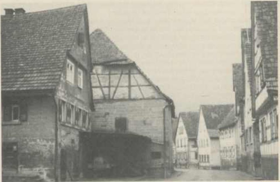
Die alte Kelter in Zaberfeld kurz vor dem Abbruch 1973, im Hintergrund die Gastwirtschaft Adler

wo früher Häuser gestanden hatten. Besonders stark war die Zerstörung zwischen der Kreuzung und Federbach. Hier könnte auch das häufige Hochwasser der Zaber schädigend mitgewirkt haben. Im Jahr 1700 war die Zahl der Häuser wieder auf 64 angewachsen und bis 1873 hatte sich die Zahl verdoppelt (126).