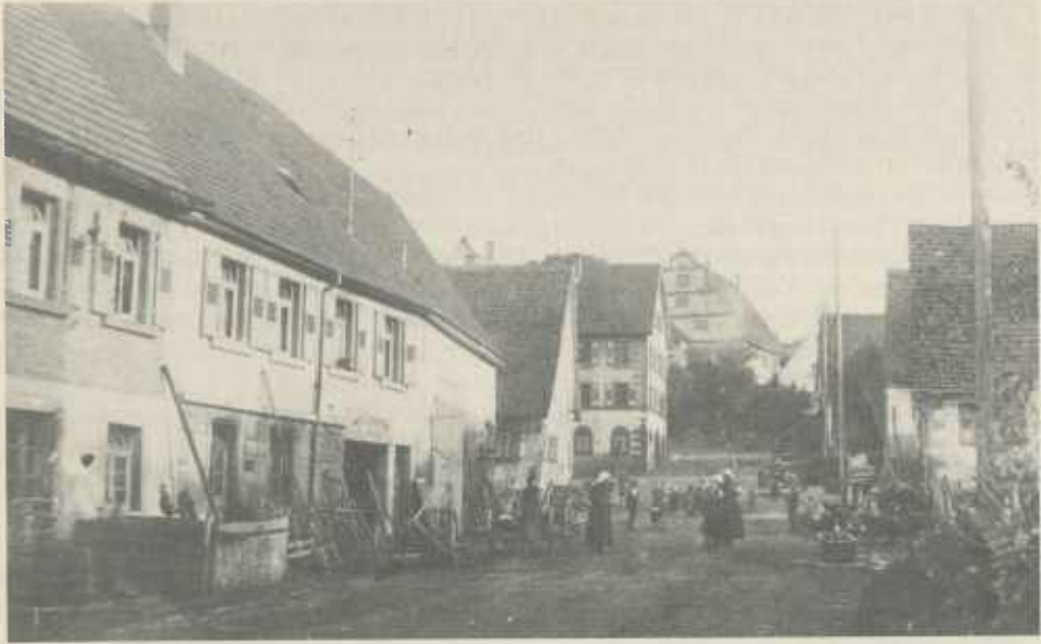
Blick von der Michelbacher Straße auf den wichtigen Kreuzungspunkt zweier Wege beim ehemaligen Schul- und Rathaus (Bildmitte) um 1919, im Hintergrund das Schloß