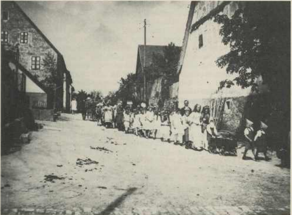
Die Steinackerstraße in Meimsheim um 1930 Vorlage: Heimatbuch Meimsheim Abb. 180