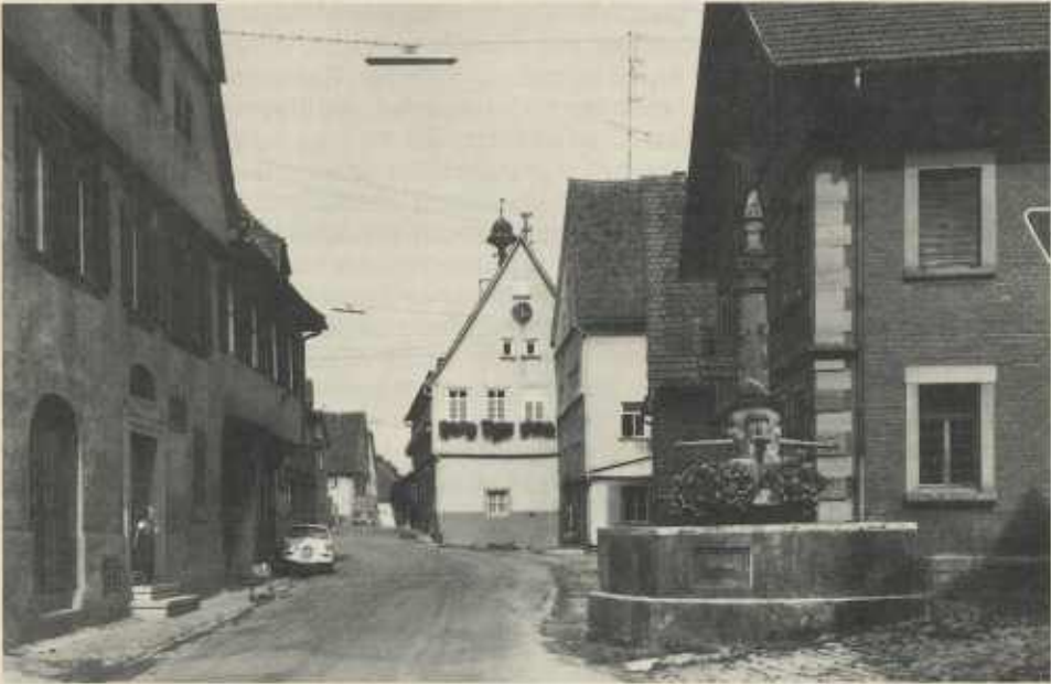
Meimsheim mit altem Rathaus um 1965