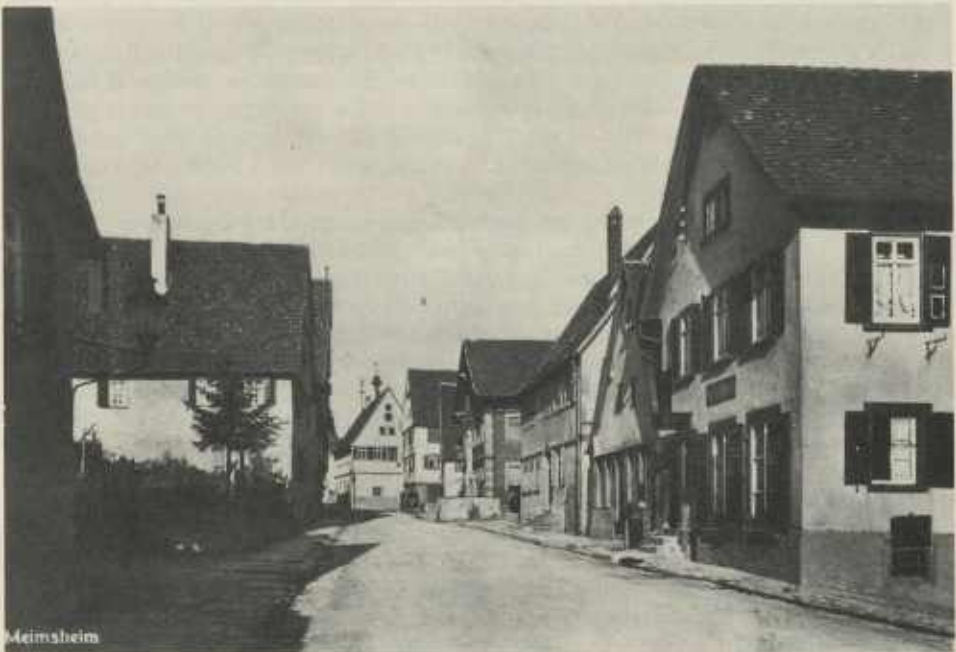
Die Bahnhofstraße in Meimsheim um 1930