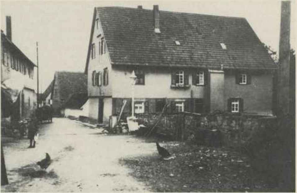
Die Mülhstraße in Meimsheim mit Westansicht der Mühle Vorlage: Heimatbuch Meimsheim Abb. 181