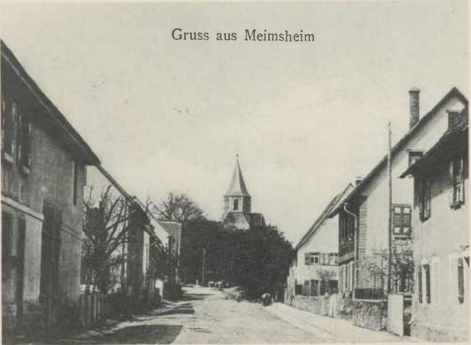
Die Lindenstraße in Meimsheim vor dem Ersten Weltkrieg