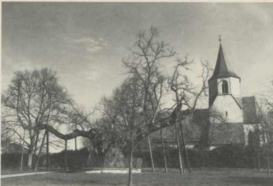
Die Meimsheimer Kirche mit der Lindenanlage 1983