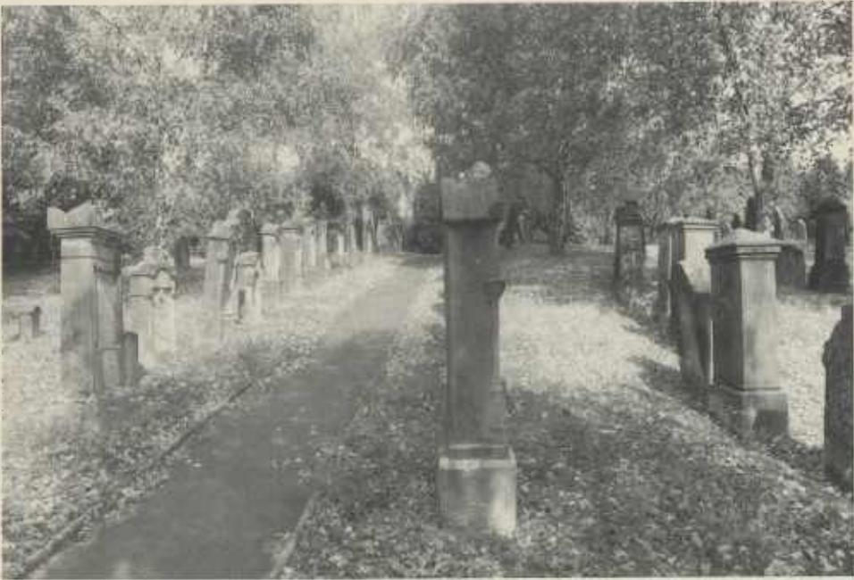
Der jüdische Friedhof in Neudenu gehört zu den ältesten im Raum um Heilbronn