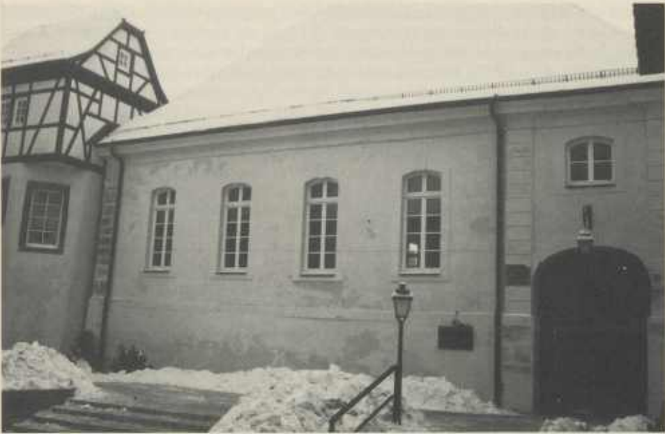
Die Synagoge in Freudental