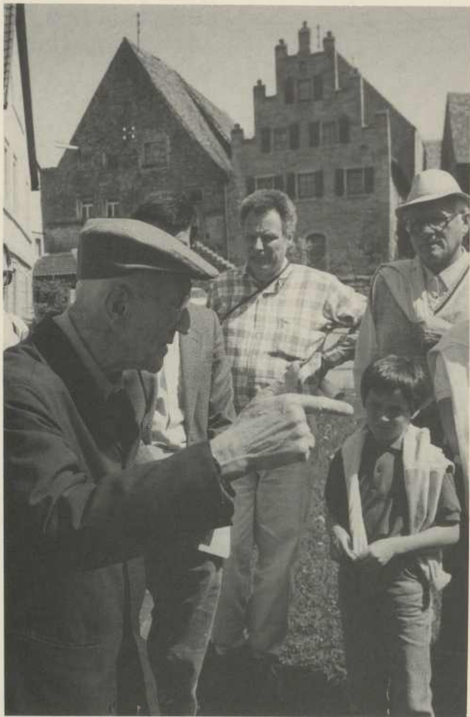
Exkursion in Ochsenburg