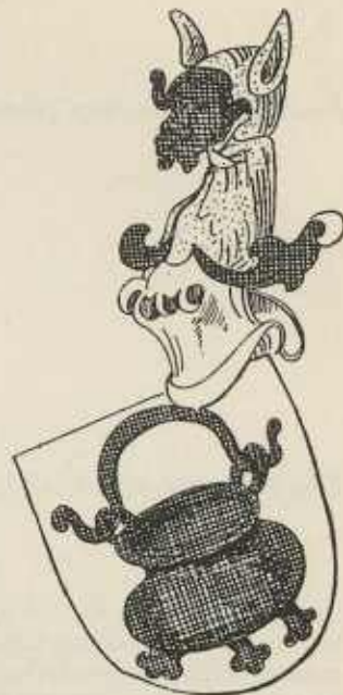
Wappen der Herren von Balzhofen