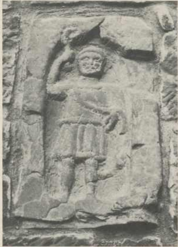
SILVANUS, Gott der Weinberge

Als Teil eines Viergöttersteins wurde diese Abbildung des Gottes Silvanus 1956 in Owen gefunden. Er hält hier in der erhobenen Rechten ein gebogenes Rebmesser, wie es bei uns bis zur Jahrhundertwende im Weinberg verwendet wurde. Damit zeigt er sich als Gott der Gärten und besonders auch der Weinberge. In einem so gesegneten Landstrich wie dem Zabergäu bestimmt nicht fehl am Platze. Er ist vermutlich auch der Namengeber des Silvaners, einer im Zabergäu beliebten Weinsorte.