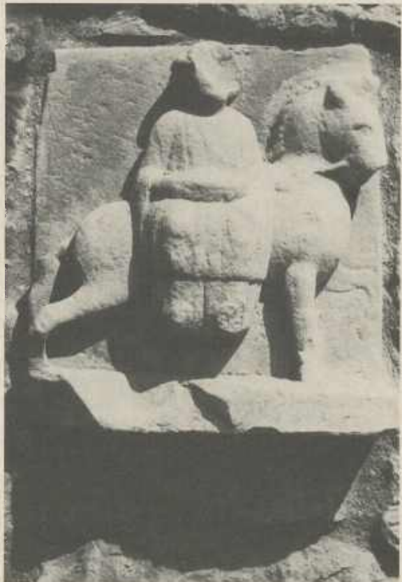
Bild rechts: EPONA reitet im Frauensitz (Hausen an der Zaber)