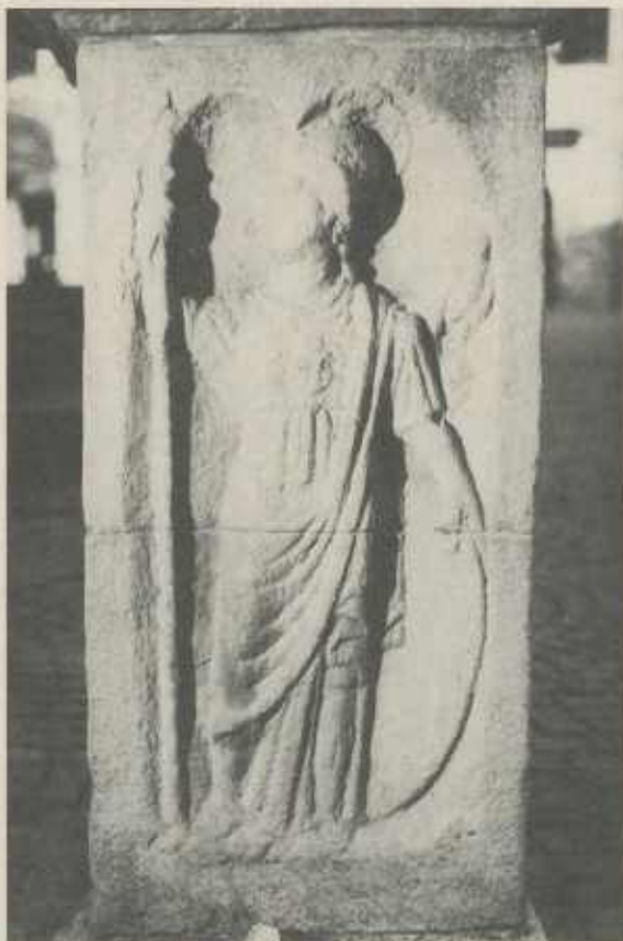
MINERVA mit der Eule auf ihrer linken Schulter