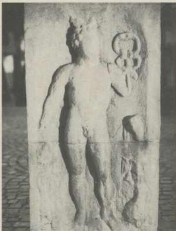
MERKUR, einer der beliebtesten Götter