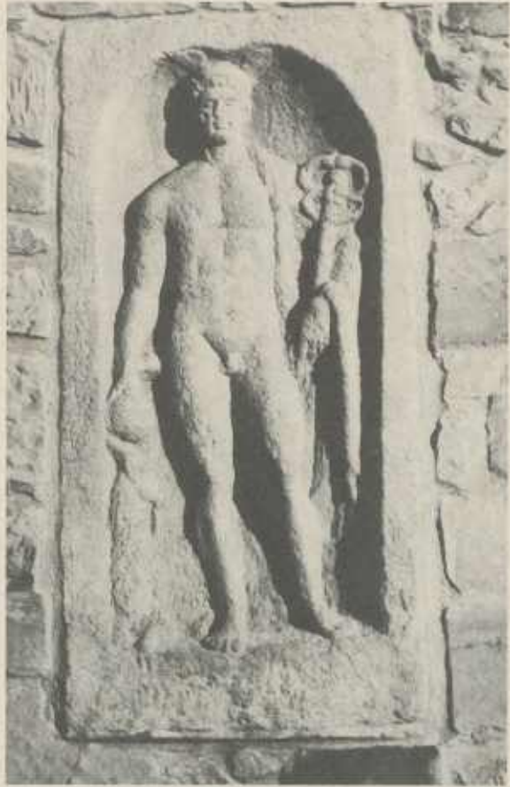
MERKUR mit Bock, Geldbeutel und Zauberstab Relief an der Herzogskeller

2d) Westwärts gerichtet ist Merkur, einer der beliebtesten und zugleich wichtigsten Götter des römischen Alltags. Für unser christlich-abendländisches Gottesverständnis ist er eher eine menschlich-allzumenschliche Figur; denn seine Gunst schützte nicht nur alle Art von Handelsgeschäften und Mittlerdiensten, sondern auch Diebstahl, Betrug und Hinterlist. Er stand denen noch bei, die Gesetz und Moral mit Geschick zu umgehen wußten.