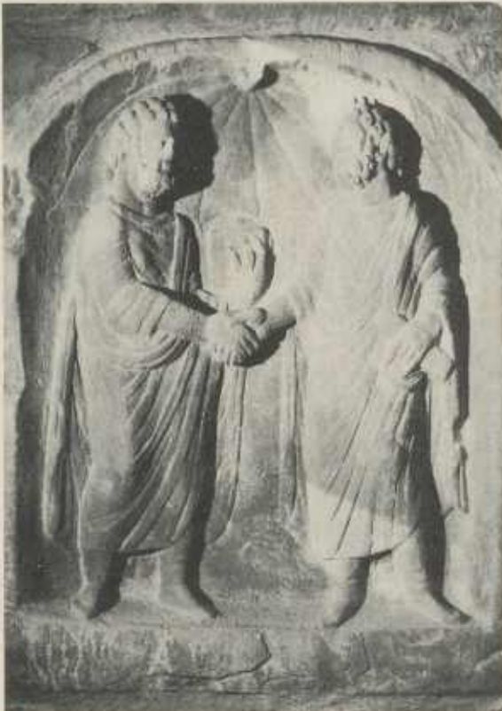
CONCORDIA, Eintracht und Versöhnung

Die Herkunft dieser würdigen und empfindungsvollen Darstellung ist unbekannt. Die Inschrift CONCORDIA auf der Nische deutet auf den Sinn der Darstellung hin. Unter einem muschelartigen Baldachin reichen sich zwei bärtige Männer als Zeichen ihrer Übereinkunft, ihrer Eintracht, die Hand. Soll damit auch an die Erstellung der Herzogskelter erinnert werden? Ein solches großes Werk ist nur gemeinsam, „in Eintracht“, möglich.