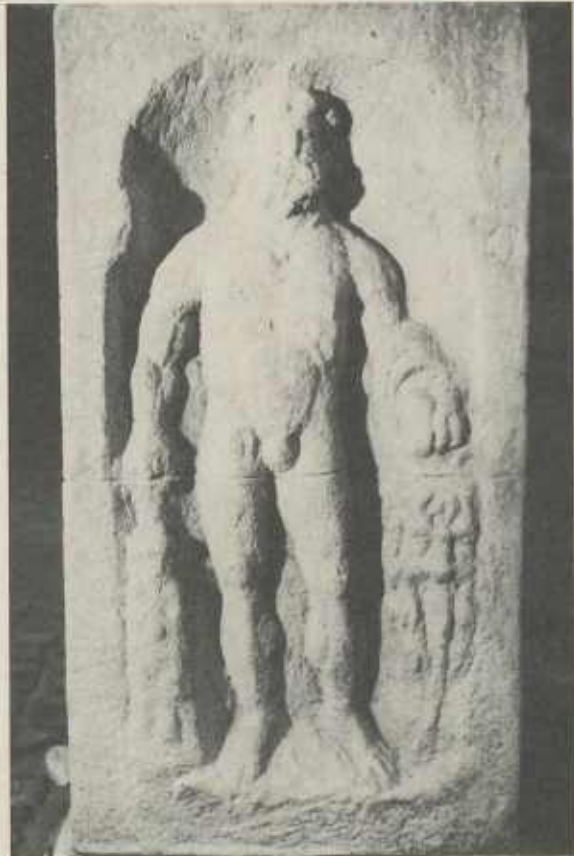
HERKULES mit seiner Keule