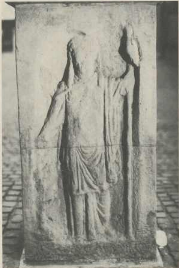
JUNO hält in der linken Hand ihr Zepter