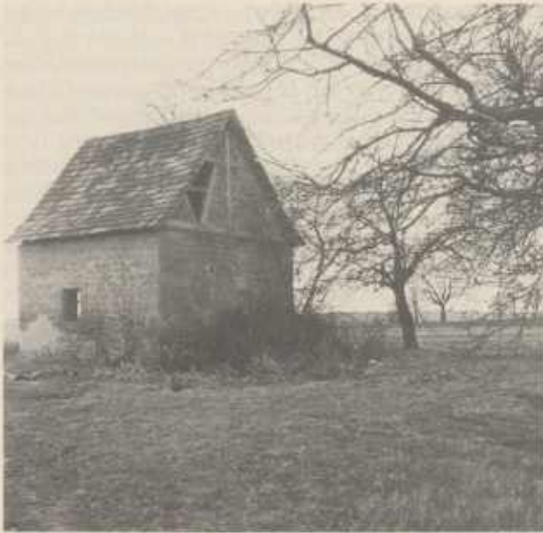
Ehemaliges Wasch- und Backhaus des Pfitzenhofs von 1800, das einzige heute noch erhaltene Gebäude des Hofes.