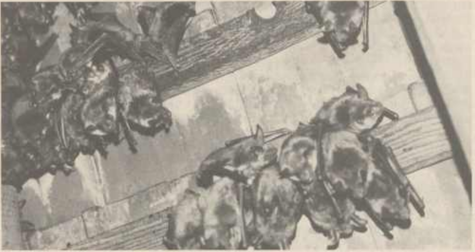
Mausohrkolonie in einem Dachstuhl