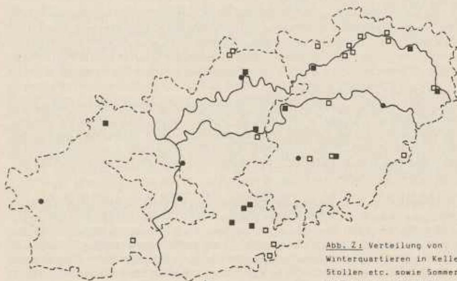
Abb. 2: Verteilung von Winterquartieren in Kellern, Ställen etc. sowie Sommerquartiere in Gebäuden

Winterquartiere (□), Sommerquartiere (■)