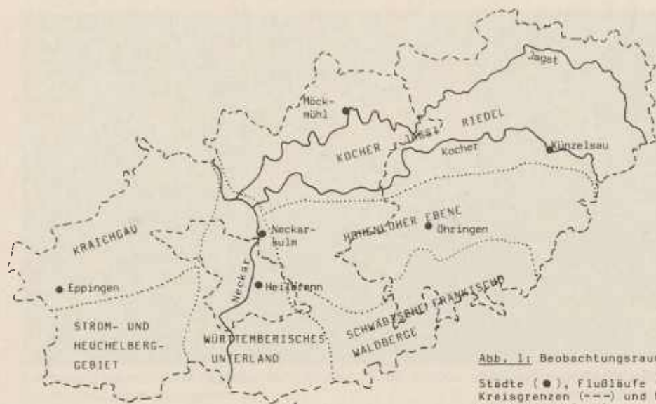
Abb. 1: Beobachtungsraum

Städte (●), Flußläufe (—), Kreisgrenzen (---) und Naturraumgrenzen (.....)