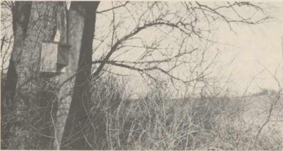
Spezielle Fledermausnistkästen können als Sommerquartier dienen, in denen die Jungtiere großgezogen werden.

Winterquartieren zeigte es sich, daß die beiden Langohr-Arten stets in kleiner Zahl oder einzeln anzutreffen waren, aber in verschiedenen Teilen des Beobachtungsraums zu finden sind. Besonders flexibel waren diese Arten auch bezüglich den Ansprüchen an ihre Quartiere im Winter. Ein Braunes Langohr überwinterte im Winter 1983/84 schon zum 3. Mal in einem Lagerkeller, der mindestens alle 3 Tage begangen wird.