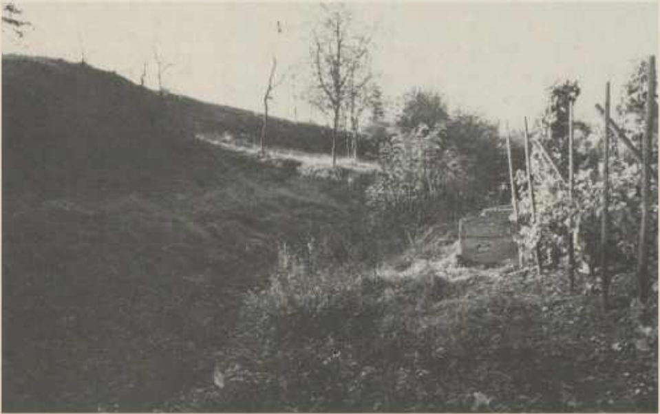
Der noch gut erkennbare Landgraben an der Markungsgrenze Nordheim/Klingenberg in der Finsterklunge

Bleich usw. eingeebnet worden. Man sieht heute noch genau, wie rechts und links die Erde von den Grundstücken genommen und zur Auffüllung verwendet worden ist. Der Landgraben, der nach dem Landturm Richtung Westen ging, verließ dann die Markung Nordheim am Fallriegel zur Heuchelberger Warte, die als Schlußpunkt und Überwachungsturm für die gesamte Neckarsenke zwischen Heilbronn und Löwensteiner Berge gedacht war.