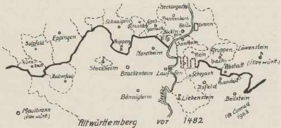
Die nördlichen Anrainer an den Landgraben (nach E. Hölzle)

Vorlage: 24. Veröffentlichung des Historischen Vereins Heilbronn