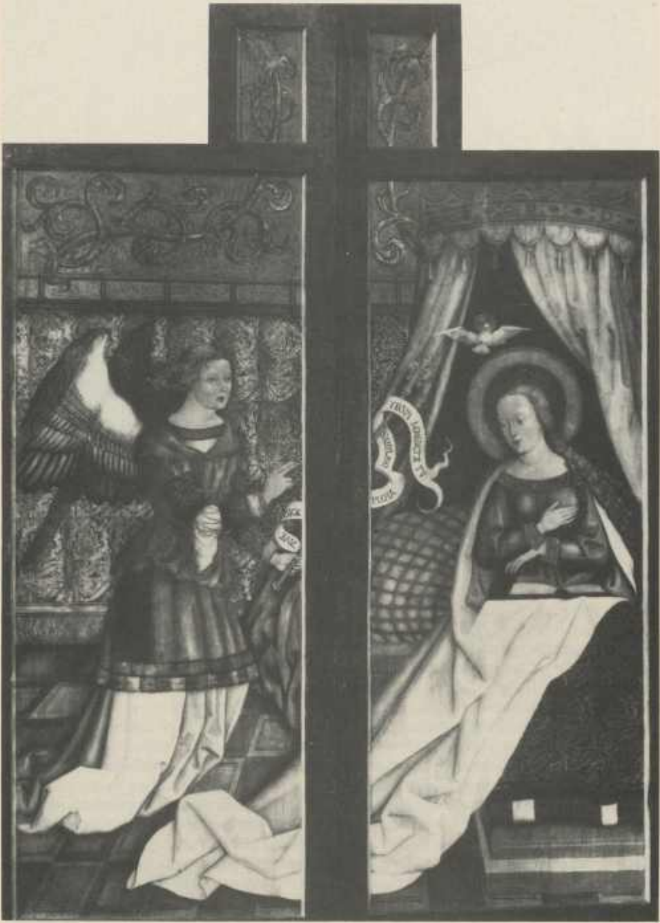
Flügelaußenseiten des Stockheimer Ulrichsaltars: Verkündigung Mariä von Jörg Kugler.

Foto: Landesdenkmalamt Stuttgart (ca. 1936)