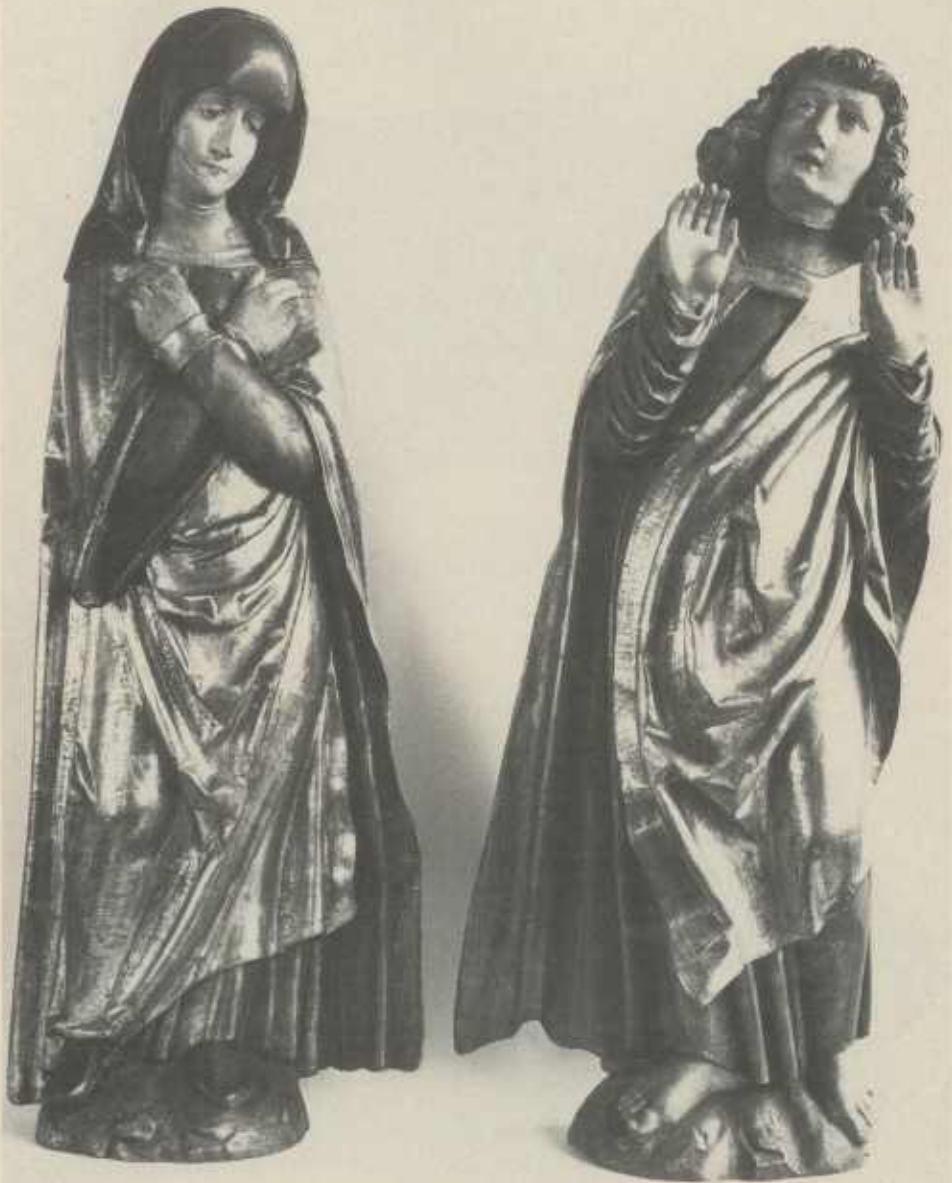
Kreuzigungsgruppe im Gesprenge: Christus zwischen Maria und Johannes.