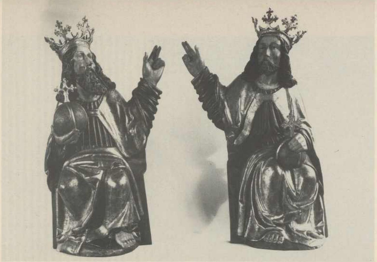
Gottvater und Christus aus dem Gesprenge des Stockheimer Altars.