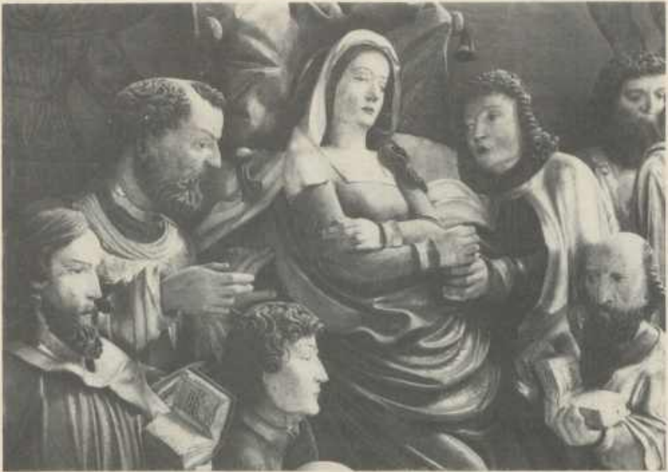
Detail aus dem Schrein des Schwaigerner Marienaltars.