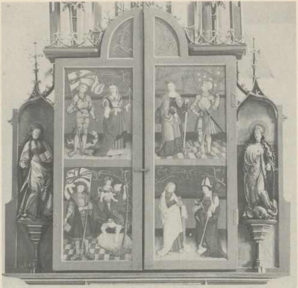
Der Marienaltar in Schwaigern, Werktagseite.