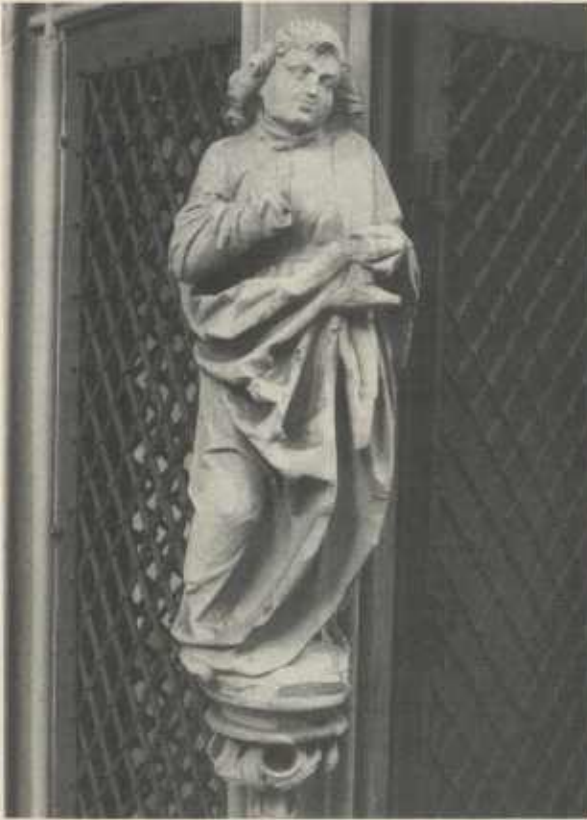
Johannes am Sakramentshäuschen der evangelischen Stadtkirche Schwaigern

gewesen sein, eine recht große Werkstatt mit mindestens einem Dutzend Mitarbeitern, die zahlreiche Retabel im Unterland lieferte. Da wir die Stockheimer Schnitzer als Gesellen am Schwaigerner Marienaltar annehmen können, muß der Stockheimer Altar nach dem Schwaigerner von 1524 angesetzt werden, vermutlich nicht allzulange danach, um 1525/27. Er wäre nun also bald 460 Jahre alt. Hoffen wir, daß die hier vorgelegten Ergebnisse und seltenen Ansichten ihm noch mehr Freunde erschließen.