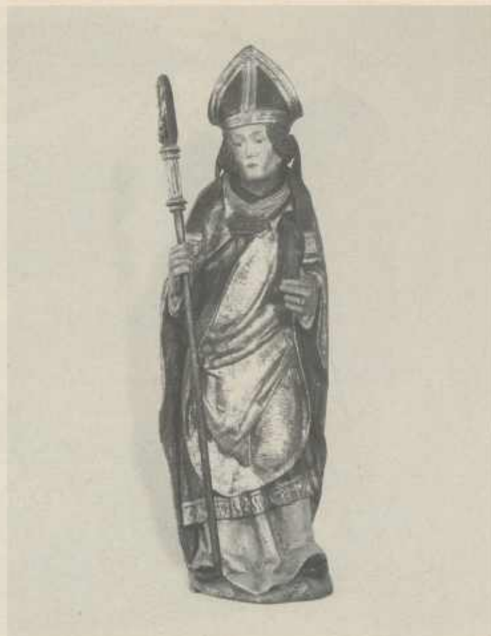
Hl. Ulrich aus dem Gesprenge.