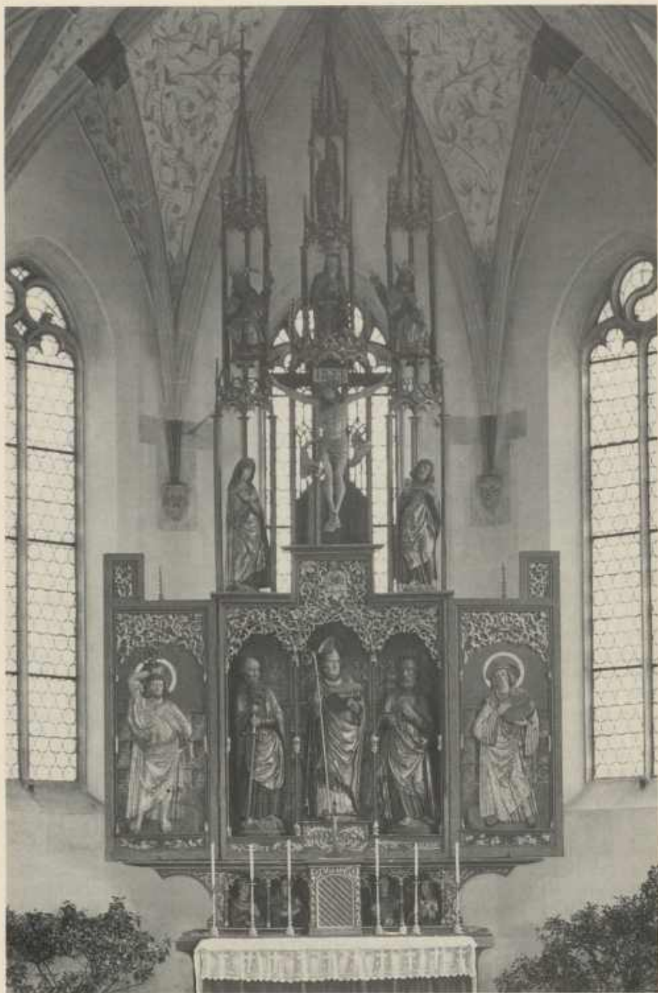
Der Stockheimer Ulrichsaltar.