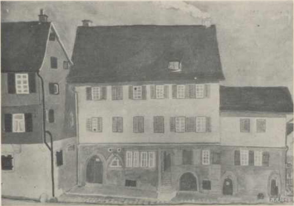
Das alte Schulhaus und Präzeptoratsgebäude in Güglingen nach einer Zeichnung von Friedrich Kaiser