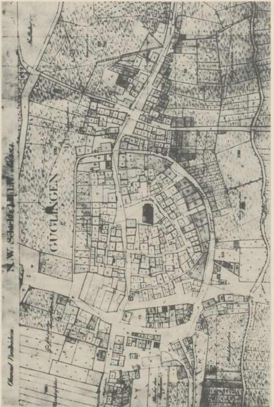
Plan der Stadt Güglingen um 1835