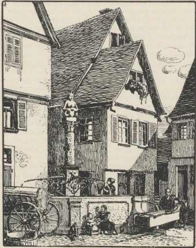
Der alte Marktbrunnen in Güglingen