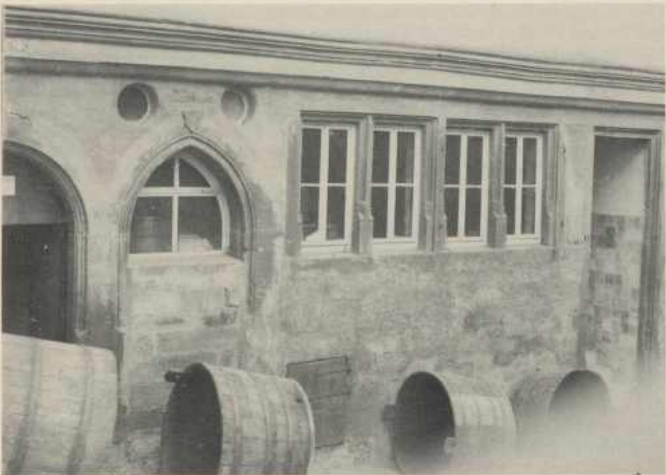
Im Untergeschoß des alten Schul- und Präzeptoratsgebäudes in Güglingen eine spitzbogige Haustür mit Hausmarke und der Jahreszahl 1604.