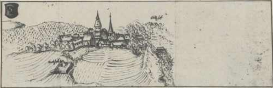
Stadtansicht von Güglingen nach Kleinsträttl (1664)