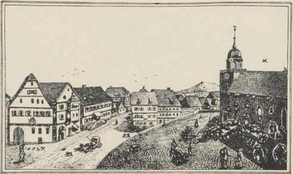
Kirche und Hauptstraße von Güglingen vor den Bränden von 1849/50