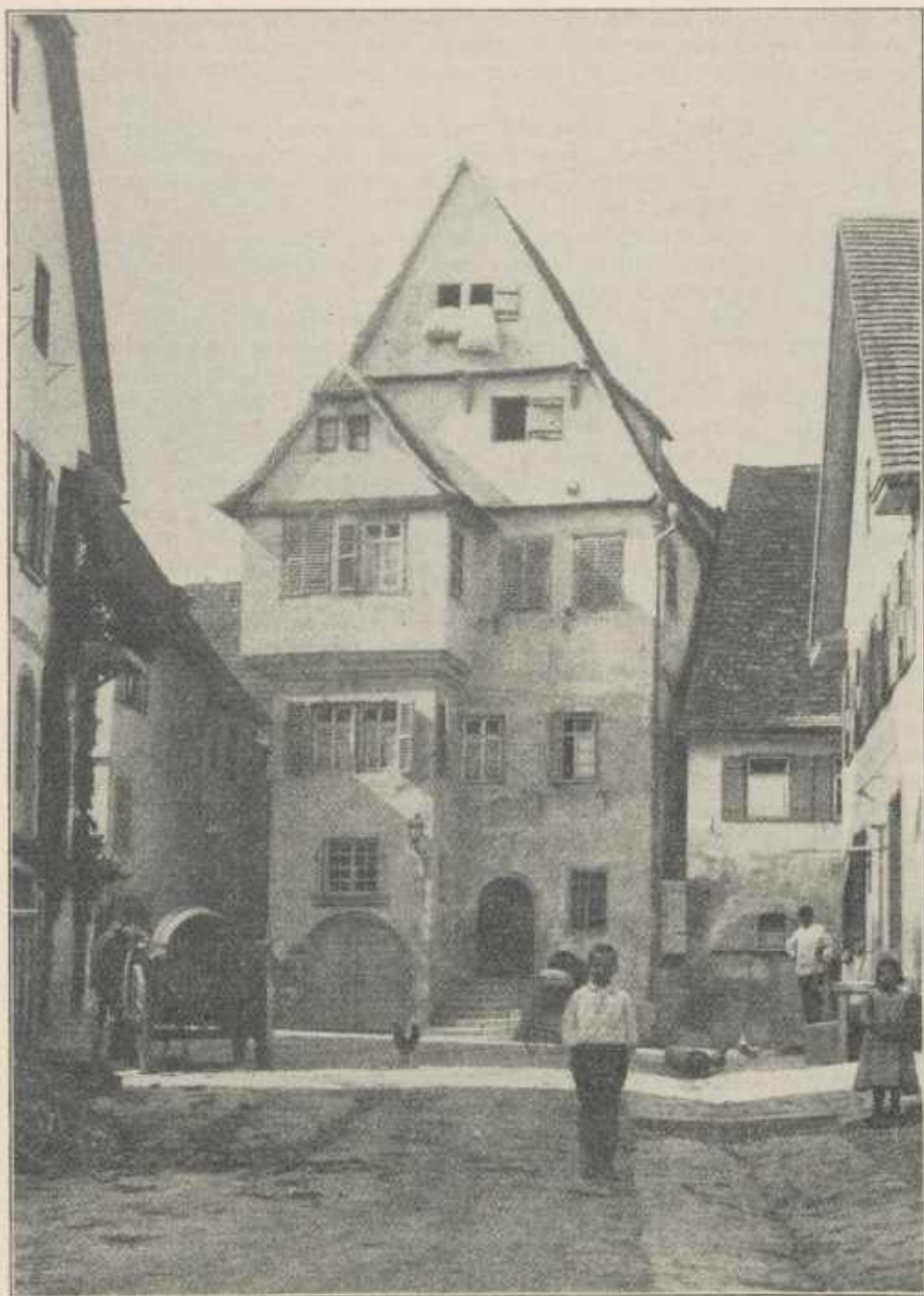
Das Helferhaus, eines der am besten erhaltenen Häuser des alten Gugglingen.