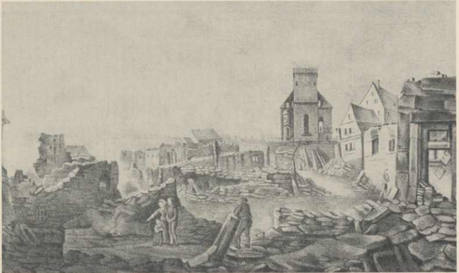
Güglingen nach dem Brand von 1849 nach einer Zeichnung von Kraneck. Rechts neben der Kirche erkennt man inmitten von Ruinen das unzerstörte Lateinschulgebäude mit Anbau.