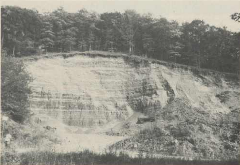
Große Mergelgrube bei Hohenhaslach, Flur Pfefferberg

Noch um die Jahrhundertwende war es eine mühevoll Arbeit der Weingärtner in den Wintermonaten, Mergel in die Weinberge zu schaffen. Mit dem frisch aus der Erde geholten Mergel wird dem Weinstock Nahrung zugeführt. Der verwitterte Boden wird also mit Mergel bedeckt, der nun wiederum verwittert und dabei seine Mineralstoffe abgibt. Weiter lockert der Mergel den alten Boden durch seine schieferige Art auf.