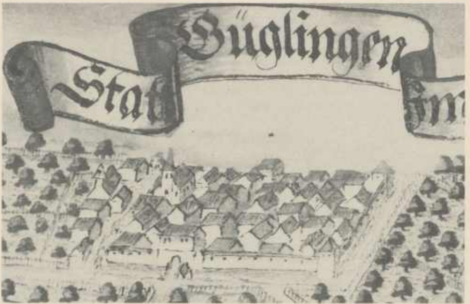
Stadtansicht von Güglingen nach Ramminger (1596)