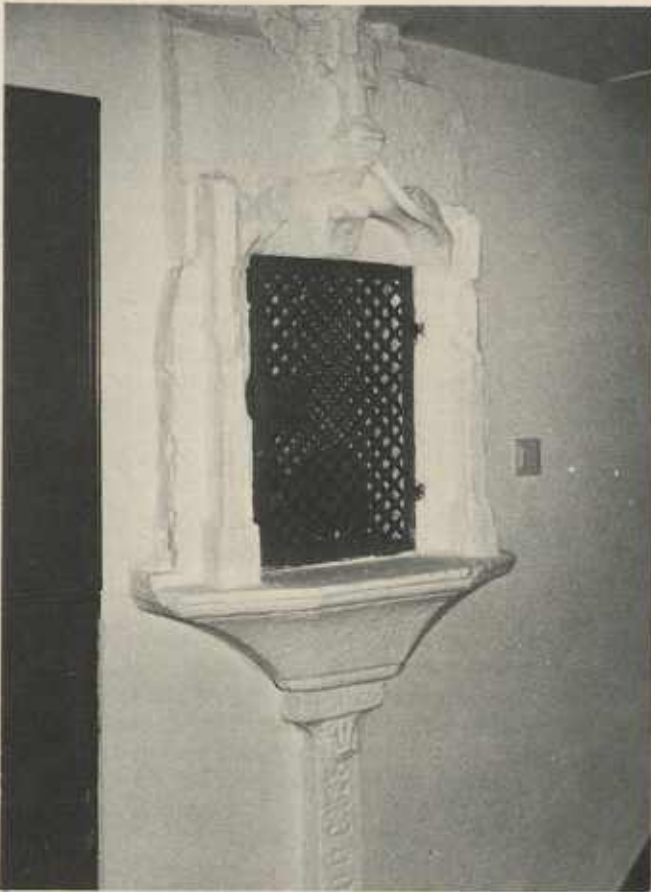
Sakramentshaus in der Kirche Michelbach am Heuchelberg

corpora seien zu Hilf der armen Leute, daß man Weib und Kinder ernähren müsse, mißdeuten also den Sinn der Eheordnung cap. I. In solchem Leichtsinn werden die meisten Verheiratungen auf unerlaubte Weise gesucht, wozu die Kirchweihstage von Kindheit an die Reiz und Gelegenheit geben. Statt eines altgewohnten, öffentlichen Kirchweihanzes sucht jeder Wirt einen Tanz im Haus, wobei kleine Kinder schon in die Zeche sitzen, wovon ich 15. 10. 1786 und 29. 5. 1788 zur hochpreislichen Regierung das Mehrere berichtet, nämlich in Armut und Leichtsinn die Presser, Debenten und Spielleute am Kirchweihstag im Wirtshaus beisammen gesessen seien. Junge Burschen haben bei der Kirchweih 3–7 Gulden Zeche bezahlt“.