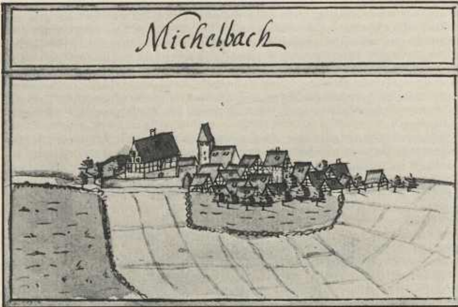
Abbildung der Michelbacher Kirche im Kieserschen Forstlagerbuch 1684 Vorlage und Aufnahme: Hauptstaatsarchiv Stuttgart H 107 Nr. 147