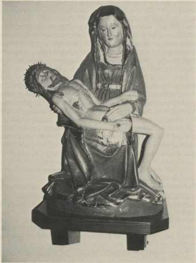
Pieta in der Kirche Michelbach am Heuchelberg