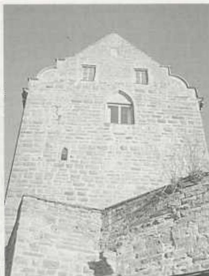
Abb. 3: Burg Magenheim, Westfront mit großem Fenster, Foto Eiermann 1999