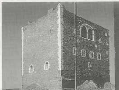
Abb. 4: Normannenschloß in Paterno, Prov. Catania, Sizilien, aus: Angheli Zalapi, Gioacchino Lanaz Tomasim, Paläste auf Sizilien , Köln 2000, Abb. S. 6/7, Foto Melo Minnella

Aufgrund seines Demonstrationscharakters regt der Palas der Burg Magenheim dazu an, sich über die Baugeschichte von Magenheim hinaus mit dem sozialen Status der Bewohner zu beschäftigen. Denn wer baulich mit dem König konkurrierte, wer es sich leisten konnte, die Funktion eines Wehrbaus nur noch vorzutäuschen, der mußte die Mittel und die ausgleichende Macht