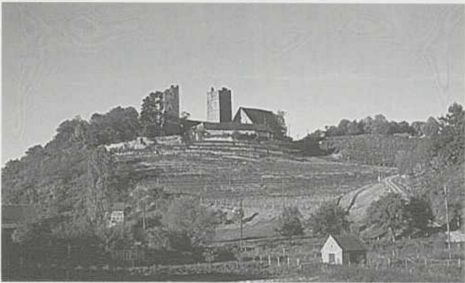
Burg Neipperg inmitten der Weinberg- und Heckenlandschaft des Zabergäus.

Wie gesagt, die Aufstellung von Leitbildern ist der Kernpunkt der Naturraumkonzeption. Hier sind zahlreiche Hinweise enthalten, die für andere Planungen – zum Beispiel für die zur kommunalen Bauleitplanung zwingend vorgeschriebene Landschafts- und Grünordnungspläne – brauchbare Vorgaben beinhalten.