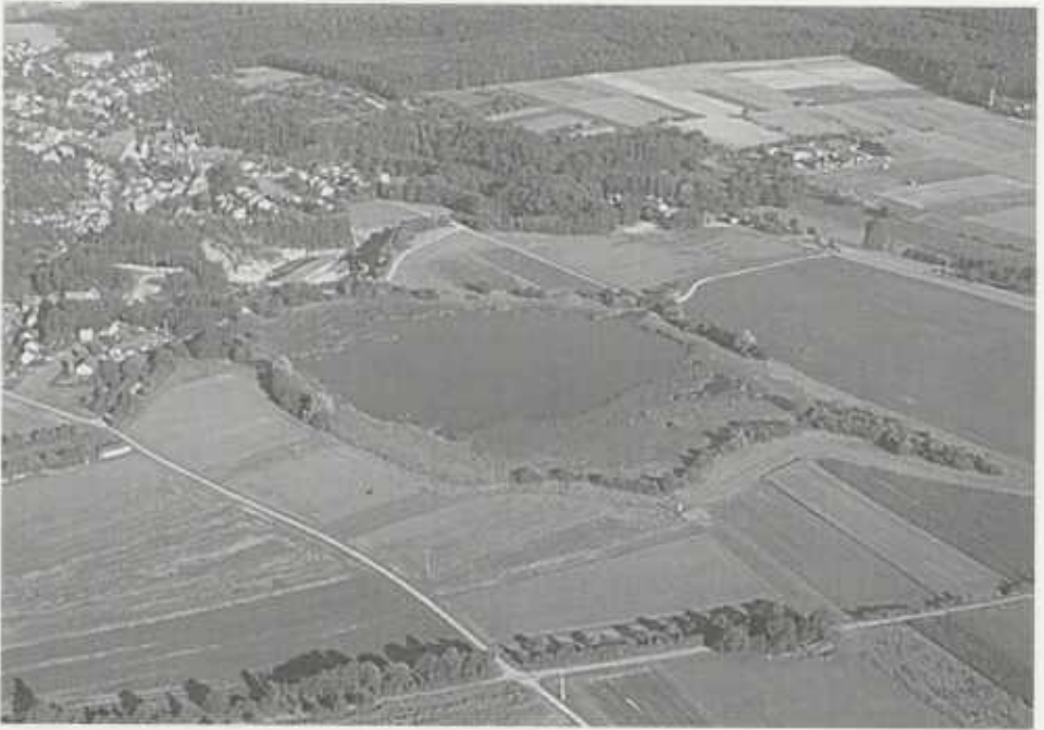
Im westlichen Stromberg-Vorland gehört das Naturschutzgebiet „Roßweiher“ bei Maulbronn zu den bedeutendsten Rückzugsräumen gefährdeter Tier- und Pflanzenarten.