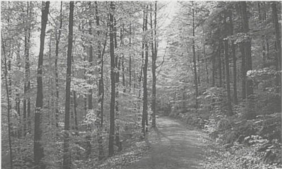
Eichen-Hainbuchen-Wälder sind typisch für weite Teile des Strom- und Heuchelbergs. Das Netz der Forst- und Wanderwege ist schier unendlich.

*) Ergänzt und überarbeitetes Vortragsmanuskript; Vortrag bei der Mitgliederversammlung des Zabergäuvvereins in Pfaffenhofen-Weiler am 10. Oktober 1999. Der Autor ist Leiter der Bezirksstelle für Naturschutz und Landschaftspflege Stuttgart (bis 1997 Karlsruhe). Herrn Dipl.-Geogr. Thomas Breunig, Karlsruhe, der die Konzeption federführend bearbeitet und betreut hat, sei gedankt für die Durchsicht dieses Manuskripts.