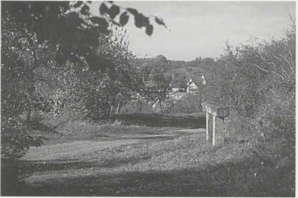
Oberhalb Diefenbach in der Obstwiesenlandschaft kreuzt ein alter Fußpfad einen neuen Weg. Hier steht eine alte steinerne Ruhebank. Wieviele Wengerter haben hier wohl schon ihre Last abgestellt?

Schaubilder. Die Geofaktoren (Geologie, Oberflächenformen, Böden, Gewässer und Klima) füllen Band 1, Band 2 enthält die Befunde der Flora und Vegetation, Band 3 diejenigen der Tierwelt. Da die Gewässer, wie schon bemerkt, die Lebensadern der Landschaft sind, wurde dem Spezialthema Limnologie ein eigener Analyseband 4 gewidmet. Band 5 beschreibt die aktuelle Landnutzung. Die dazugehörige Karte im Maßstab 1 : 50.000 – nebenbei: die kartographische Bearbeitung erfolgte im Rahmen einer Diplomarbeit und ist deshalb bis ins einzelne ausgefeilt – zeigt sehr übersichtlich das kleingliedrige Mosaik der Nutzungen. – So wichtig die Niederlegung der Ergebnisse jahrelanger Untersuchungen in dicken Bänden auch ist, so wenig sind diese geeignet, von Nicht-Wissenschaftlern gelesen zu werden. Die zahllosen Daten ermüden, sind schwer verdauliche Kost. Der Zabergäuverein besitzt übrigens die fünf Bände in seiner Bibliothek.