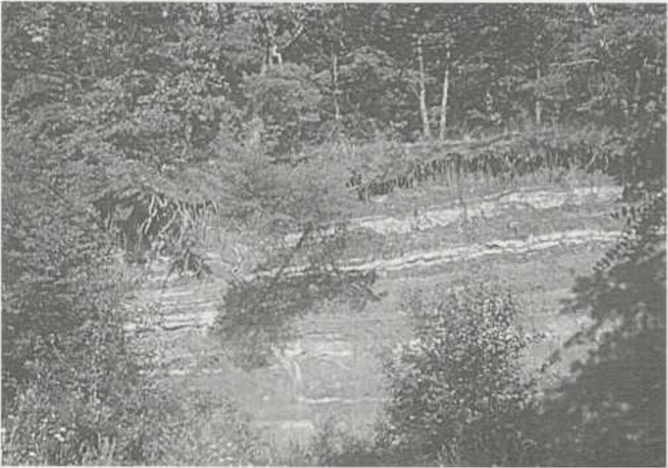
Die Mergelgrube oberhalb Hohenhaslach zeigt eine aufgeschlossene Verwerfung. Rechts einer schrägen Kluftlinie liegen alle Schichten einen halben Meter tiefer als links.