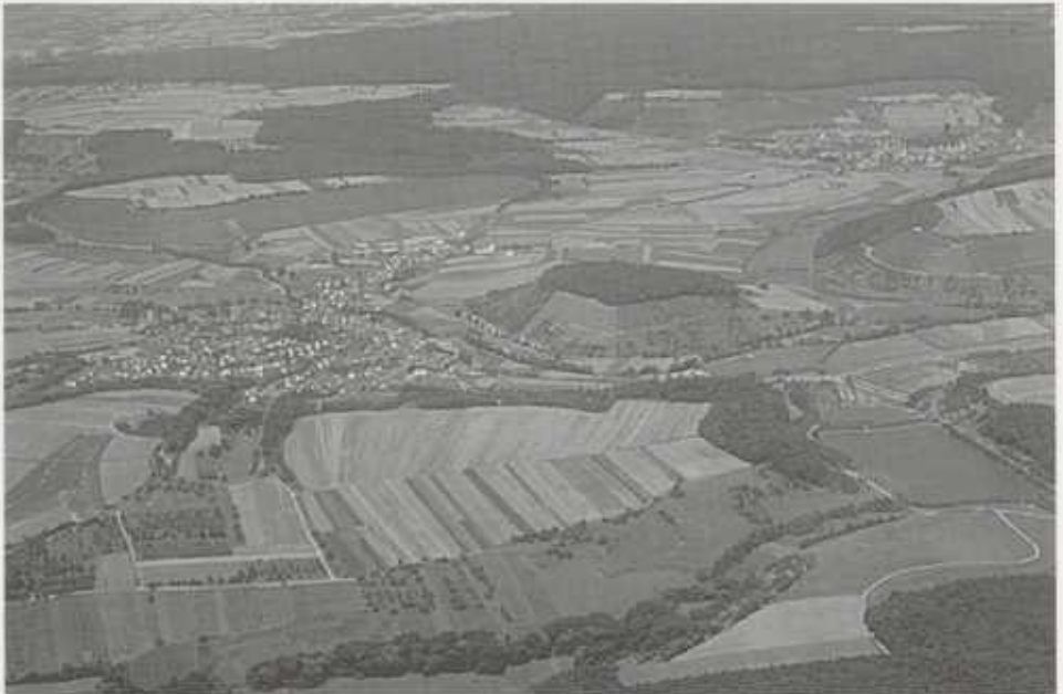
Zaberfeld und Umgebung. Die Ausgewogenheit der Oberflächenformen, das Mosaik der Nutzungen und die Vielfalt der Kulturlandschaft machen den besonderen Reiz des oberen Zabergäus aus. (Luftbild 1983)