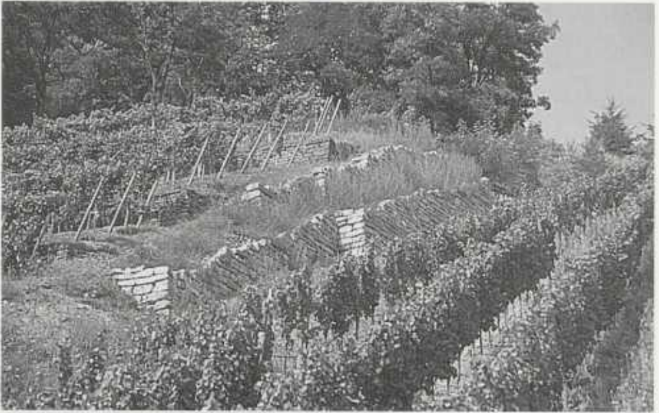
Trockenmauern in der neuen Weinberglandschaft sind bei der Bewirtschaftung hinderlich. Doch nicht überall stören sie: Am Zweifelberg bei Brackenheim hat man einige Mauern sogar neu aufgeführt – Refugium für Eidechsen und manch anderes Getier.

Die „Empfehlungen und Hinweise zur Umsetzung“ bilden das letzte große Kapitel der Konzeption. Für die Landschafts- und Raumplanung, für den Bereich landwirtschaftlich genutzter Flächen und für den Wald werden eine Vielzahl möglicher Maßnahmen aufgestellt, die bewirken, daß die aufgestellten Ziele erreicht werden können. Das geht von Empfehlungen zur möglichst naturnahen Bewirtschaftung von Wiesenland bis hin zur Auflistung geeigneter Gehölze und geeigneten Saatgutes im Landschaftsbau. Vorschläge für spezielle Artenhilfsmaßnahmen, zum Beispiel für die Mauereidechse, sind ebenfalls enthalten.