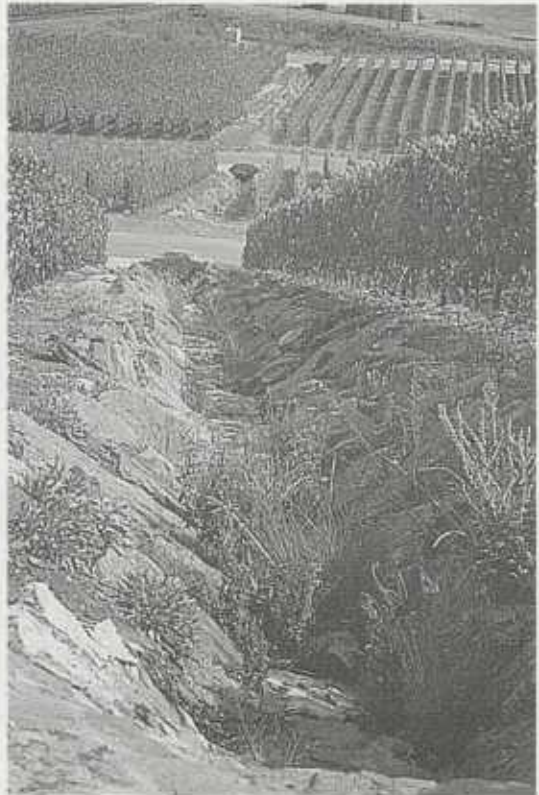
Wasserstaffeln in der neuen Weinberglandschaft müssen nicht aus Beton sein: Hier in Brackenheim am Zweifelberg hat man mit Erfolg eine naturnahe Bauweise eingesetzt.