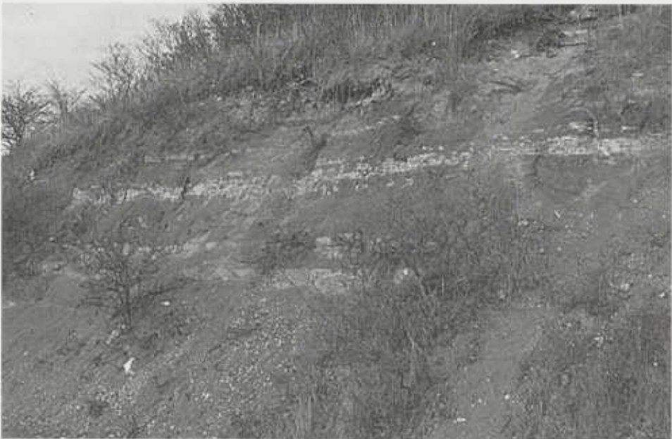
Einblick in den Untergrund. Die bunten Mergel bilden den Steilanstieg im Stromberg. Hier ein Aufschluß am Weinbergweg beim Füllmenbacher Hofberg.

„Wieder ein Plan mehr“ wird der eine oder andere sagen und das Heft zu anderen ins Regal stellen. Jawohl, wieder ein Planwerk. Aber diesmal keines, das neue Baugebiete, neue Straßen, neue Erholungseinrichtungen zum Inhalt hat. Nein, diesmal liegt etwas ganz anderes vor, nämlich eine Bilanz von Natur und Landschaft samt einem Entwicklungskonzept. Und deshalb sollte jeder, der in dieser Landschaft zu tun hat, einmal in diesem Heft blättern. Er wird ein Bild der Landschaft des Strom- und Heuchelbergs und des westlichen Zabergäus finden, wie er es nicht gewohnt ist – ein Bild, das Fachleute gezeichnet haben, die Natur und Landschaft mit anderen Augen sehen als Planer und Architekten.