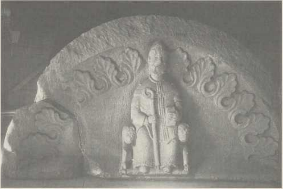
Das Lauffener „Martins-Tympanon“

Nikolauskapelle im Städtle identifiziert 4 ), gab, hängt es zusammen, daß man den Dargestellten als Martin von Tours bezeichnete, der der erste Patron der Lauffener Regiswindiskirche gewesen war. In meinem Buch 750 Jahre Regiswindiskirche Lauffen am Neckar faßte ich 1977 den damaligen Wissensstand zusammen mit den Worten: Gegen Ende des 18. Jahrhunderts wurde bei der Neckarmühle im Wasser ein Tympanon gefunden. Nach längerer Diskussion konnte das heute im Landesmuseum Stuttgart bewahrte Kunstwerk als Darstellung des Hl. Martin von Tours als Bischof gedeutet werden. Es steht zu vermuten, daß dieses Tympanon vom Portal der mittelromanischen Kirche St. Martin stammt. 5