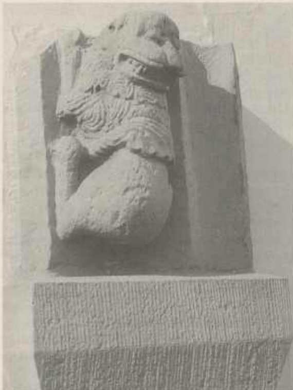
Löwenskulptur aus romanischer Zeit an der südlichen Sakristei, im letzten Jahrhundert noch am Westgiebel der Kirche angebracht.

Die Frage nach dem Warum dieser Schenkungen, ist damit noch nicht befriedigend gelöst – oder nur teilweise: wir haben angedeutet, daß Herrschaft und Kirche eng verknüpft waren, daß kirchliche Posten und kirchlicher Besitz und kirchliche Einnahmen mit weltlichem eine Einheit bilden konnte – ein Bischofsitz oder aber eine Klosterleitung war lukrativ, versprach Aus- und Einkommen. (Nicht von ungefähr wurde jetzt in der Diskussion in Reformkreisen der Kirche der Ruf nach Ehelosigkeit der Geistlichen laut, bis dahin war es nicht unüblich für Bischöfe und Priester, Familien und Kinder zu haben und diesen natürlich die Stelle zu vererben.)