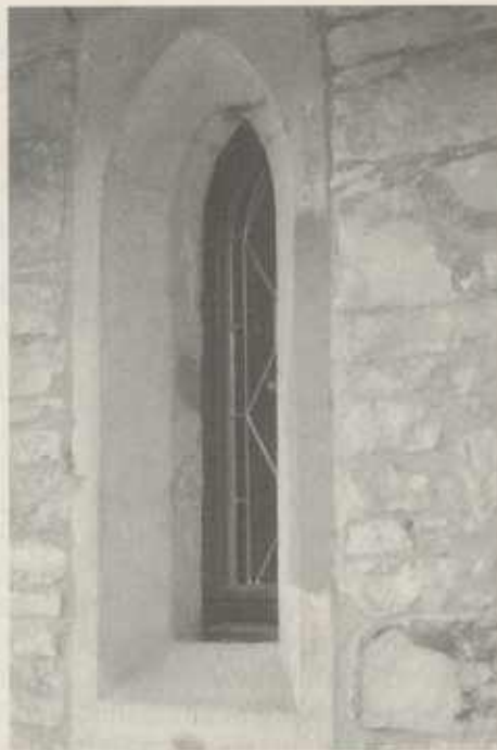
Gotische Fenster aus der abgebrochenen „Zehntscheuer“ in neuer Verwendung auf der Rückseite des heutigen Pfarrsaals.

Blüte hinter sich und endete im Jahre 1543 im abgeschiedenen Kirbachtal. Frauenzimmern wurde zum Bestandteil des Amtes Güglingen für vier Jahrhunderte.