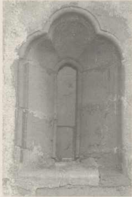
Kleeblattfenster an der Kirchennordseite.

nahezu vorprogrammiert. Denn die Abgaben bzw. die Einnahmen, in erster Linie der Zehnte, ursprünglich eine Steuer für die Kirche, hatten im Laufe der Zeit begonnen, ein lukratives und bewegtes Eigenleben zu führen, waren nun schon teilweise in den Händen von Laien, also des Adels, waren vererbbar, verkäuflich, Handelsware der Herrschenden geworden. Es hatte sozusagen eine Privatisierung von öffentlichen Aufgaben und öffentlichen Abgaben eingesetzt. – Zugegeben ein Begriff aus unseren Tagen und natürlich ein unzulässiger Analogieschluß. Aber, hält man sich vor Augen, daß in Frauenzimmern die letzten Reste des in jene Zeit zurückreichenden, und im Laufe der Jahrhunderte immer komplizierter gewordenen Abgabensystems erst im Jahre 1873 beendet waren und deren Ende damals enthusiastisch begrüßt wurde, zum Beispiel vom Frauenzimmerer Pfarrer Heim in seiner Ortschronik von 1873, dann wundert sich der Laie von heute, wenn er von Diskussionen um private Autobahnen, um private Verkehrsleitsysteme, von privaten Post- und Botendiensten und anderen Dienstleitungen liest, als wäre das Rad erfunden. – Doch kehren wir schnell zurück zu unserer Urkunde: Wenn nun versucht wurde, Besitztitel, Eigentumsübertragungen, Übertragungen von mit Einkünften verbundenen Rechten usw. urkundlich festzuhalten, sogar gerichtlich zu klären, so haben wir hier mit einem Grund für die große Zahl der nun auftauchen-