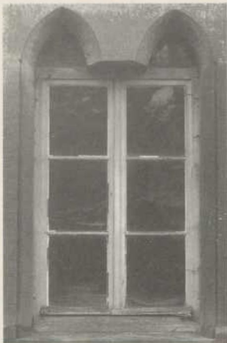
Gedoppeltes Spitzbogenfenster in der ehemaligen, sogenannten Zehntscheuer (Anwesen Blükle) westlich des Pfarrhauses. Sie war einst ein Teil des Klosters oder stand auf dessen Fundamenten bzw. an der Stelle eines Klosterflügels. An den Seitenwänden befanden sich gotische Fenster. Pfarrer Berner berichtet noch von einem gotischen Portal mit zwei Heiligenbildnischen (Oberamtsbeschreibung 1873: „spitzbogiger Eingang im Westen“).