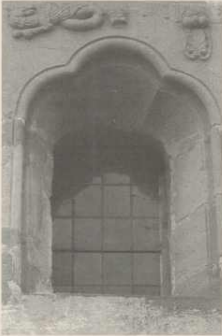
Romanisches Kleeblattfenster an der Südseite der Martinskirche. Oben links ein verschlungener Drache und rechts ein menschlicher Kopf, der ein palmettenartiges Blatt im Munde trägt.