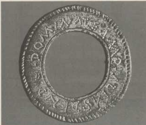
Römische Scheibenfibel mit Liebesinschrift. Durchmesser 2,1 cm.

Verlassen wir noch einmal kurz die großen Züge der Weltgeschichte, in denen die Menschen oft nur als statistische Größe vorkommen – neben den Großen wohlgemerkt: Konstantin der Große und Karl der Große und wie sie alle heißen. Oft sind es dann gerade die kleinen unscheinbaren Funde, die im Schatten des Spektakulären und der öffentlichen Selbstdarstellung – z.B. eines reichen aristokratischen Besitzers durch reiche Reliefszenen in Frauenzimmern – ein kleines privates, menschliches Licht aufleuchten lassen. Wie jene unscheinbare 2,1 cm große Scheibenfibel, gefunden in einer Schuttschicht auf dem Gutshof in Frauenzimmern. Sie ist aus verzinnter Bronze, also: kein wertvolles Stück, sondern Einfache-Leute-Schmuck, Modeschmuck sozusagen. – Domina te amo und die Abkürzung aliasdend, also: a(nimo) li(bendi) a(micae) s(uae) de(ae) n(omine) d(at) steht darauf. Herrin ich liebe dich – schreibt da jemand und weiter, daß er das Schmuckstück mit Vergnügen im Namen der Göttin, wohl der Liebesgöttin Venus, gibt.