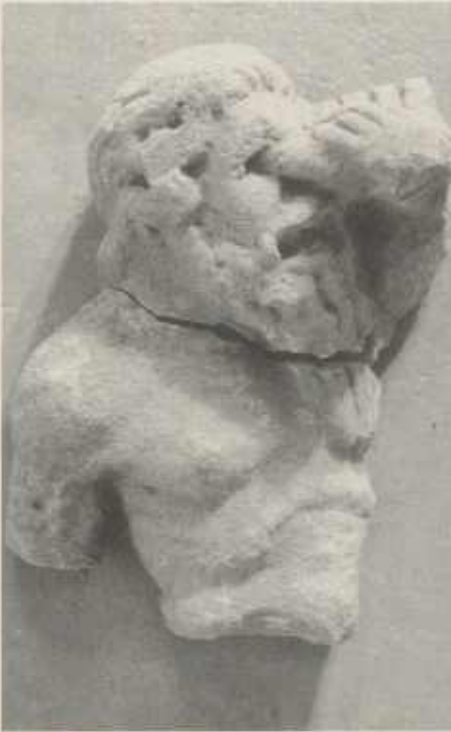
Der Polyphem von Frauenzimmern. Zwei anpassende Relieffragmente, Höhe ca. 30 cm, zeigen die Blendung des Polyphem.