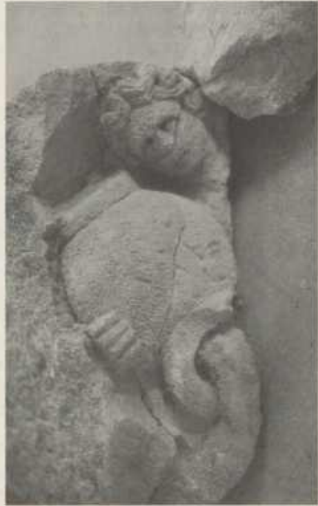
Zwei anpassende Bruchstücke einer Nympe mit Gießgefäß, Höhe ca. 39 cm.

Meine Damen und Herren, beeindruckend an den Fundstücken in der Villa Rustica ist nicht allein deren künstlerische Qualität, sondern vor allem die Tatsache, daß der Gutsherr auch in der fernen Provinz nicht darauf verzichten wollte, seinen Schönheitssinn zu demonstrieren, auch seinen Wohlstand – natürlich –, aber ganz besonders seine griechisch-römische Bildung und Tradition. – Ja nicht nur zu demonstrieren, sondern auch weiterzugeben an den Betrachter: zu bilden.