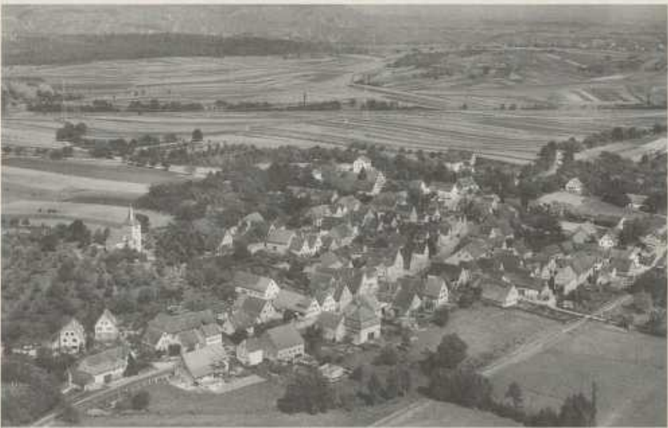
Blick über Frauenzimmern, um 1960.

Festvortrag am 1. September 1995 in der Festhalle in Frauenzimmern anlässlich der 1200-Jahrfeier.