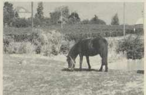
Katharinenplaisir bei Cleeborn mit Landhaus hinter dem Gut

Schon immer haben Wiesen, Wälder und Felder sowie Weinberge zu dem Anwesen gehört. In einer Urkunde von 1774 sind darüberhinaus Teiche, über 1000 Obstbäume „aleenweis gepflanzt“ erwähnt, ein Garten mit Gartenhaus „auf der Mauer“, Ställe und