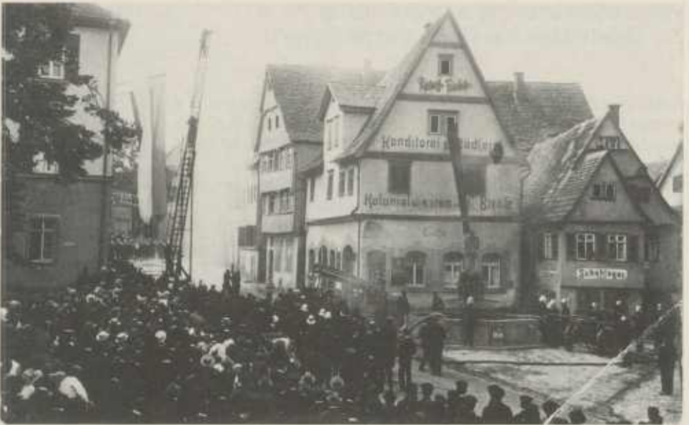
„Große Angriffsübung“ beim Bezirksfeuerwehrtag 1929 in Güglingen