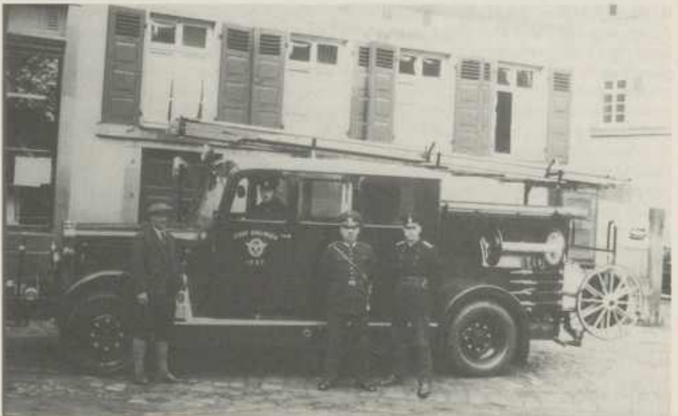
Das 1937 gebraucht gekaufte Löschfahrzeug tat bis 1968 seinen Dienst. Aufnahme vor dem alten Amtshaus, in der Mitte Kommandant Karl Wolff.