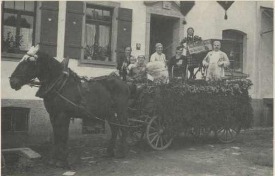
Vor der Güglinger Stadtmühle 1933/34