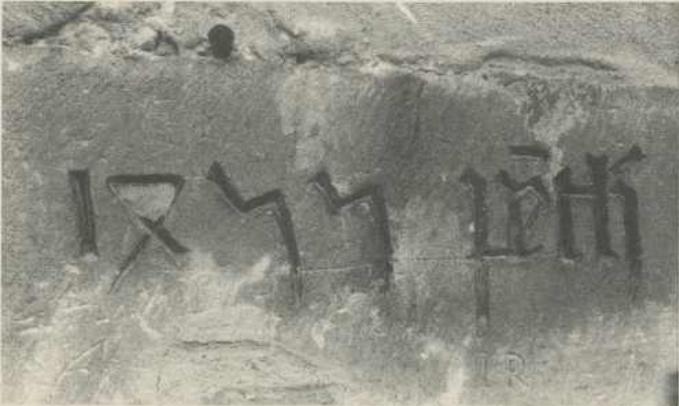
Inschrift am Portal der Martinskirche in Meimsheim

Der Schriftzug dagegen ist nicht so deutlich zu erklären. Es ist außergewöhnlich, daß im 15. Jahrhundert ein Baumeister seinen Namen, dazu noch den Familiennamen (damals wurde meist nur der Vorname genannt), an so wesentlicher Stelle angebracht haben sollte. Mir selbst ist dafür kein Beispiel bekannt; normalerweise verstecken sich Nennungen an weniger leicht einsehbaren Orten. Auch der Name selbst ist reine Hypothese, da die Familie Pfenning ja erst später genannt wird. Aus lautlichen Gründen muß man einwenden, daß im süddeutschen Raum eher „pfeng/pheng/pfenk“ geschrieben worden wäre; doch auch das k am Ende des Wortes wäre selten. Vom Standpunkt der Paläographie (Kunde der alten Schrifttypen) ist einzuwenden, daß die als k gedeutete Figur nicht der damaligen Schreibung eines k entspricht.