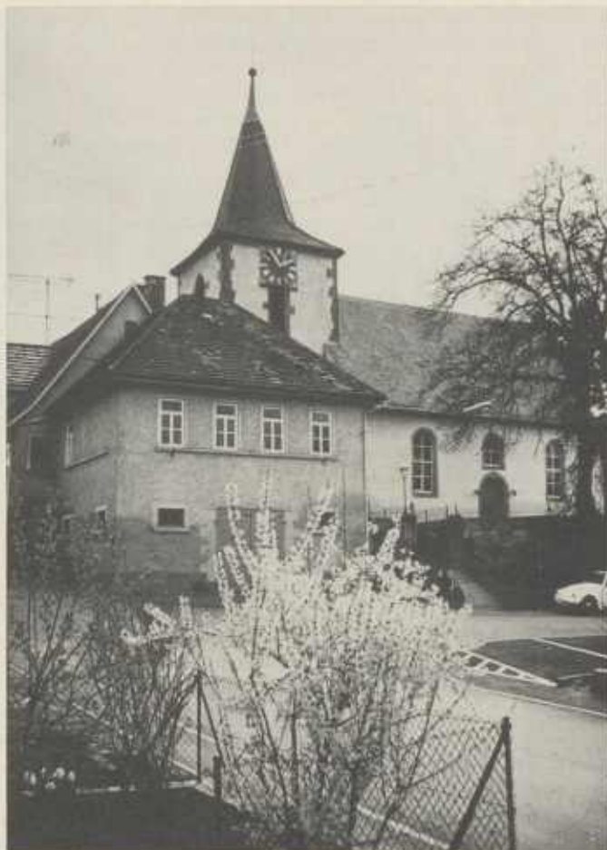
Altes Schulhaus mit Kirche in Weiler