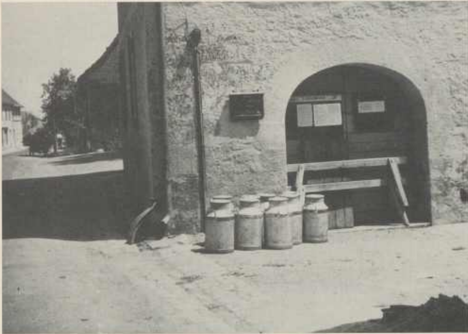
Alte Milchsammelstelle im Rathaus Weiler