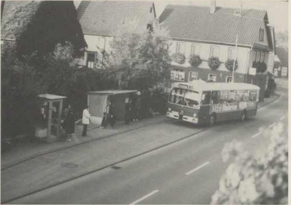
Rathaus, jetzt Verwaltungsstelle in Weiler