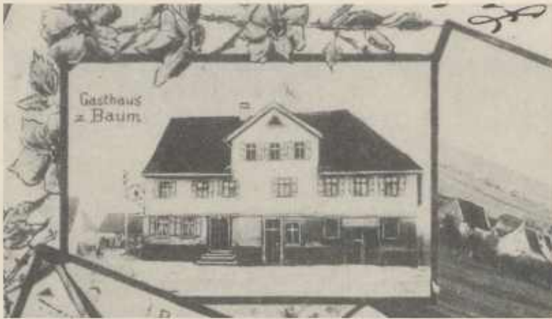
Das Gasthaus „Zum Grünen Baum“ in Botenheim um 1900 (Ausschnitt aus einer Postkarte)

„Wirt für kein Maß Gewährschaft geleistet und kommt in Aufstreich Häuser und Gebäu.“ Ferner waren noch Äcker, Wiesen und Weinberge dem Verkauf ausgesetzt.