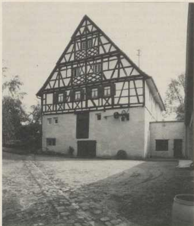
Die Bromberger Mühle mit dem heute zerstörten Wasserrad