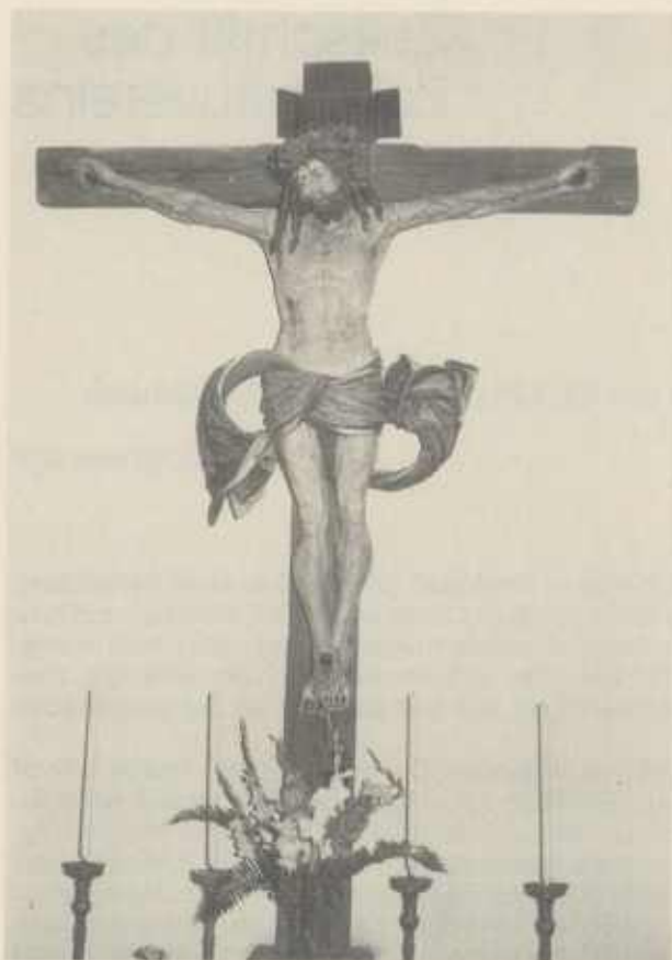
Kruzifixus in der katholischen Pfarrkirche Stockheim