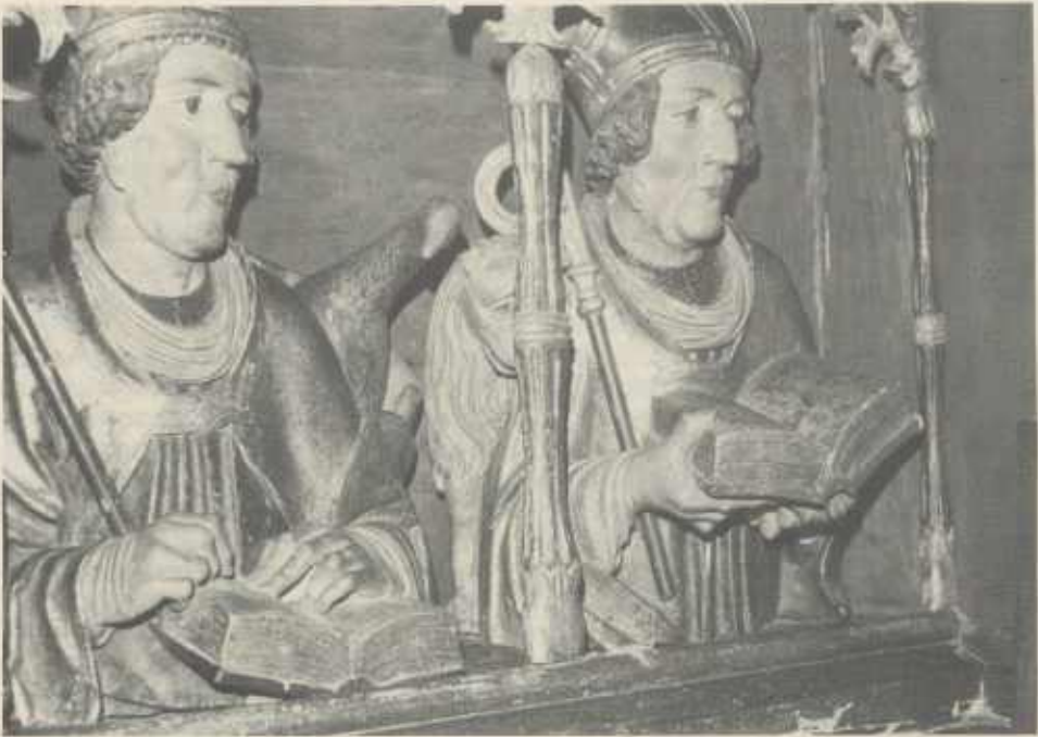
Ausschnitte aus dem Ulrichsalter in der katholischen Pfarrkirche Stockheim: Die 4 Kirchenväter in der Predella