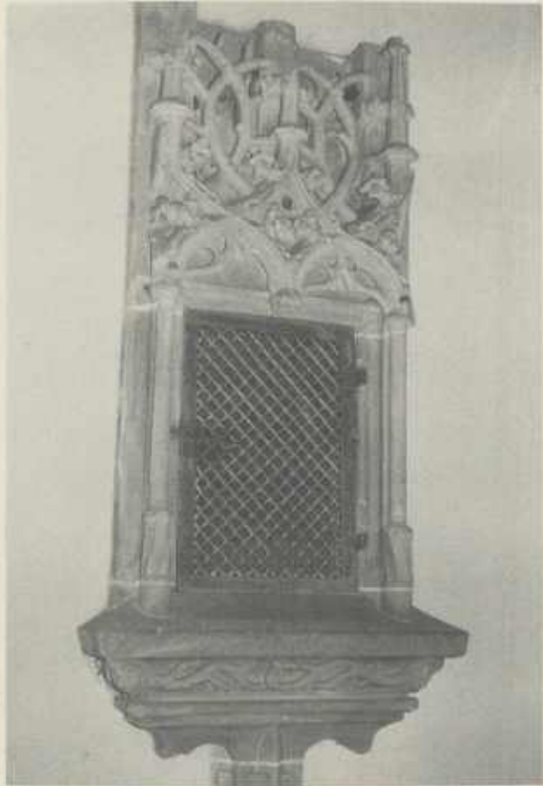
Sakramentshäuschen in der katholischen Pfarrkirche Stockheim