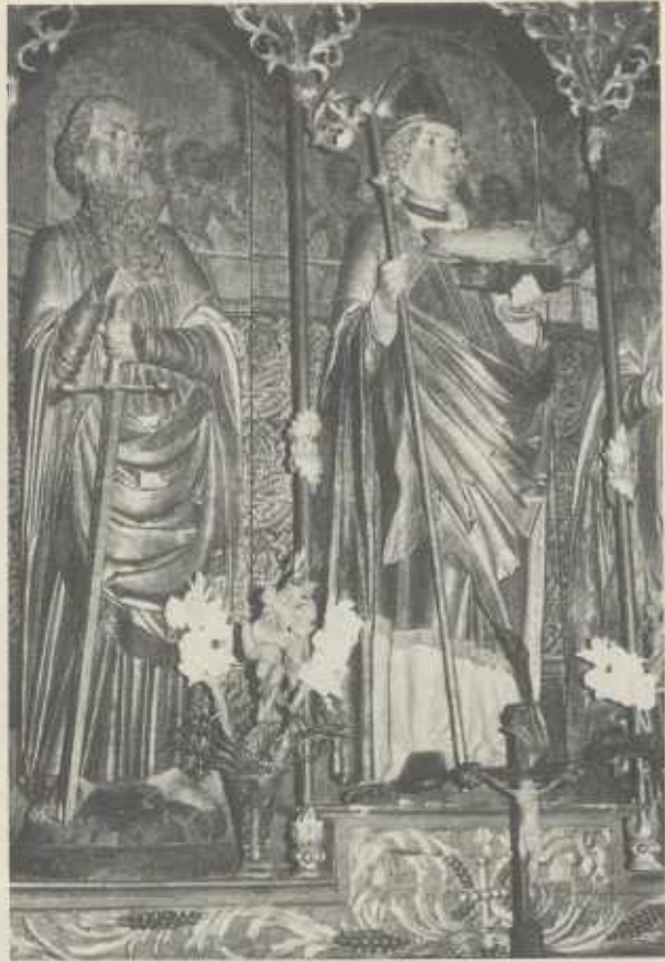
Ausschnitt aus dem Ulrichsaltar in der katholischen Pfarrkirche Stockheim mit dem Kirchenpatron Ulrich in der Schreinmitte, daneben Paulus mit dem Schwert

nische) beidseitig zwei durch knorpelige Stämmchen getrennte Raumfelder mit Halbfiguren; sie schließt außen gerade ab. Bei geschlossenem Altar werden neben dem Schrein zwei gemalte Standflügel sichtbar.