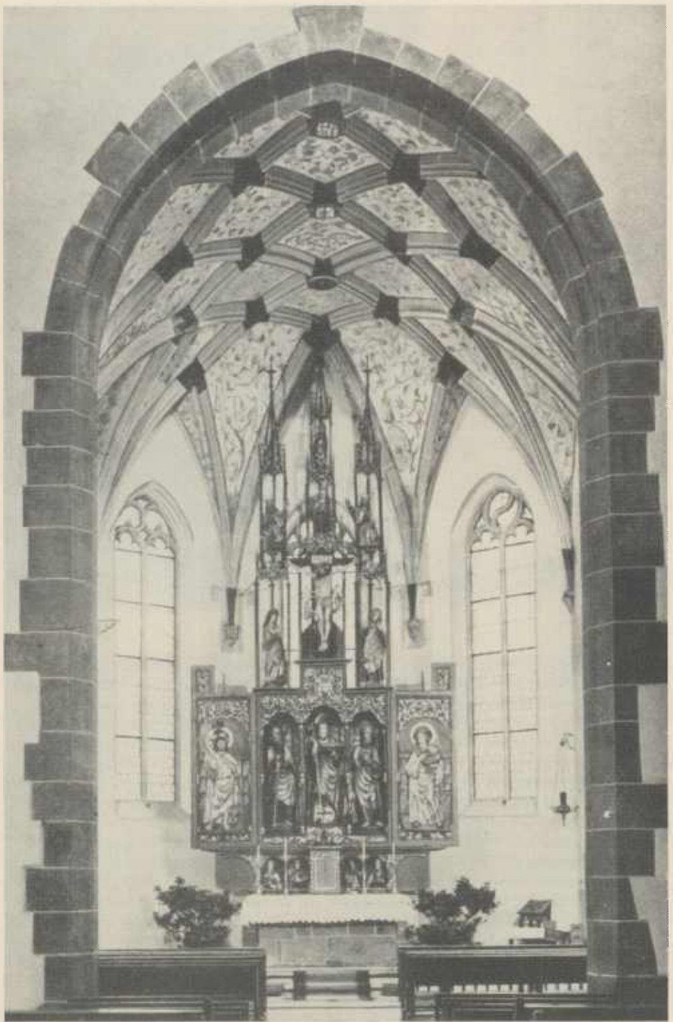
Ulrichsaltar in der katholischen Pfarrkirche Stockheim