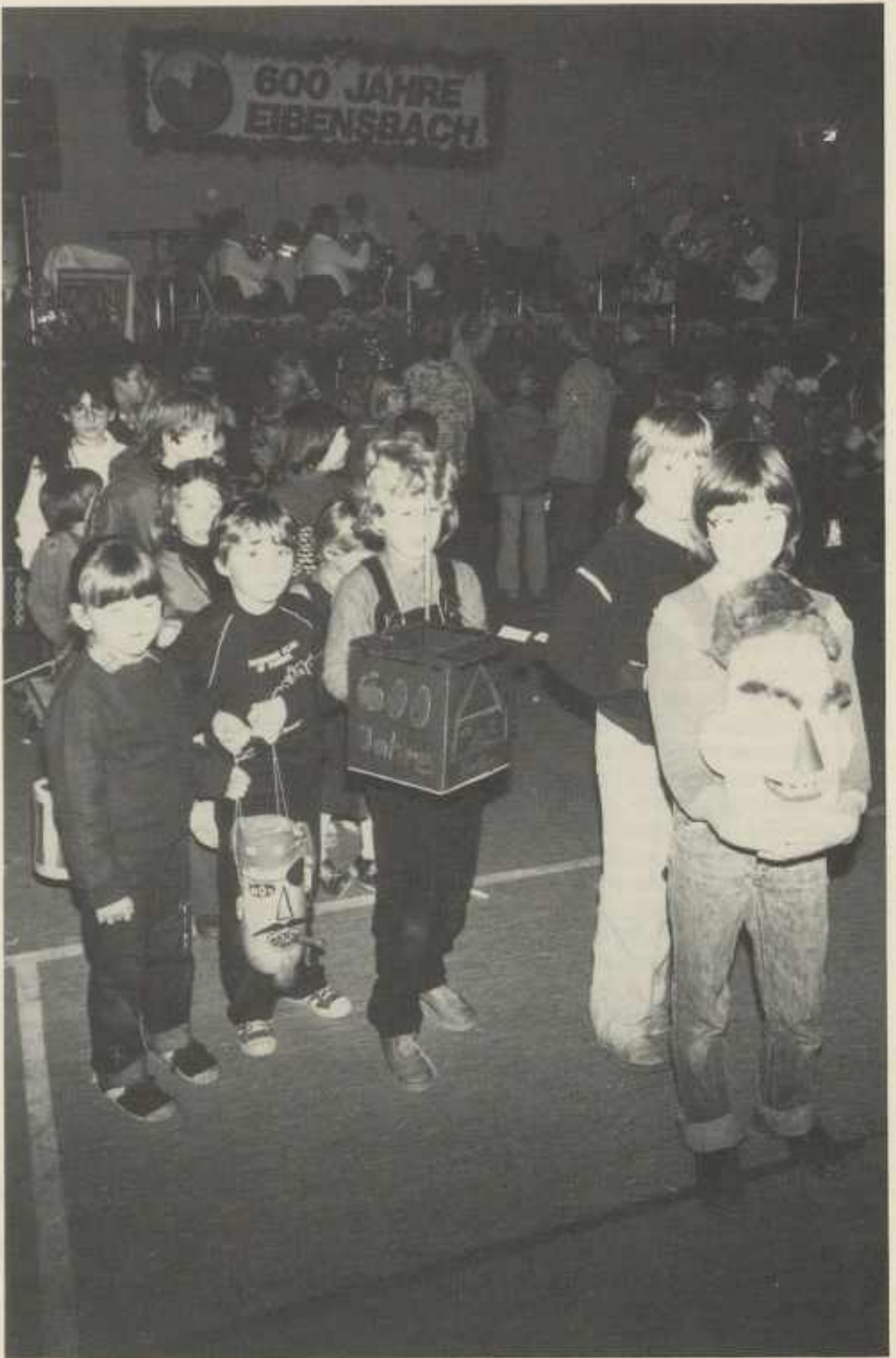
600 Jahre Eibensbach – Kinderfest