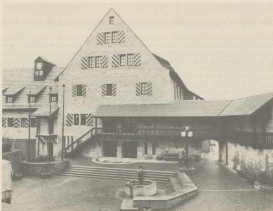
Die Güglinger Herzogskelter – Tagungsort und Thema der diesjährigen Hauptversammlung