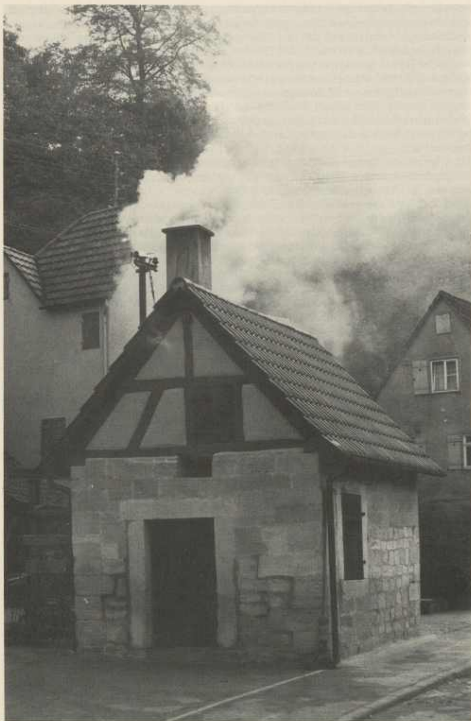
Das Eibensbacher Backhäusle