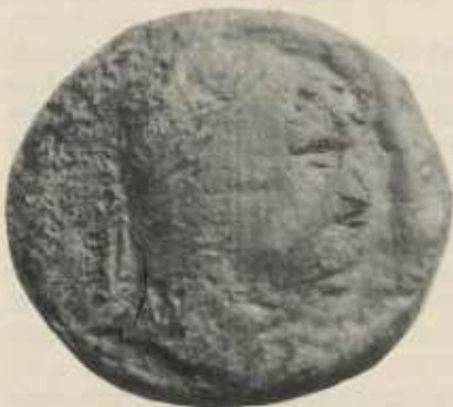
Die gefundene, schlecht erhaltene Münze des Kaisers Hadrian

Diese kleine Ausführung zeigt, wieviel aus solch unscheinbaren Funden geschlossen werden kann und welche Bedeutung sie für die Geschichte unserer Heimat haben. An dieser Stelle soll auch Herrn Hamm für das Überlassen der Funde und für sein Verständnis für Belange der Denkmalpflege gedankt werden. Vielleicht wird aufgrund dieser Funde ein weiterer römischer Gutshof auf Gemarkung Bönningheim entdeckt.