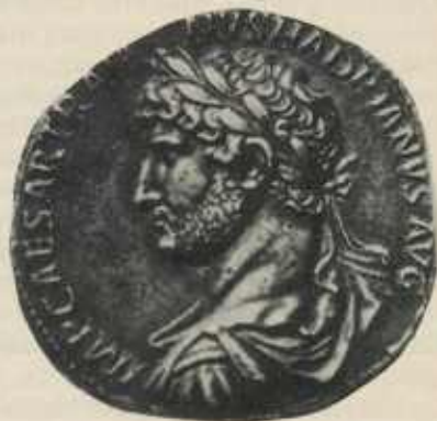
Münzbildnis des Kaisers Hadrian