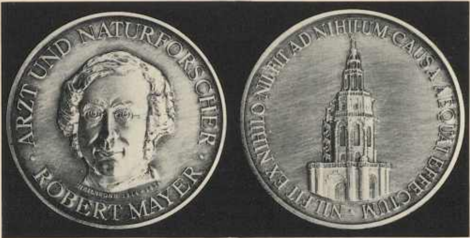
Robert-Mayer-Medaille, die das Andenken an den bedeutenden Heilbronner Arzt und Naturforscher lebendig erhalten soll. Der lateinische Text auf der Rückseite erinnert an die Kernsätze im Denken Robert Mayers: Nichts wird aus Nichts. Nichts wird zu nichts. Ursache und Wirkung sind einander gleichwertig