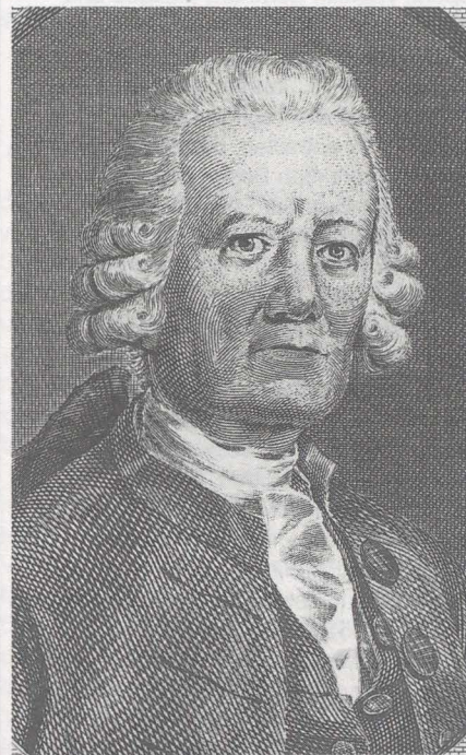
Johann Jakob Moser (1701-1785), berühmter Rechtsgelehrter, 1751-1759 Landschaftskonsulent.