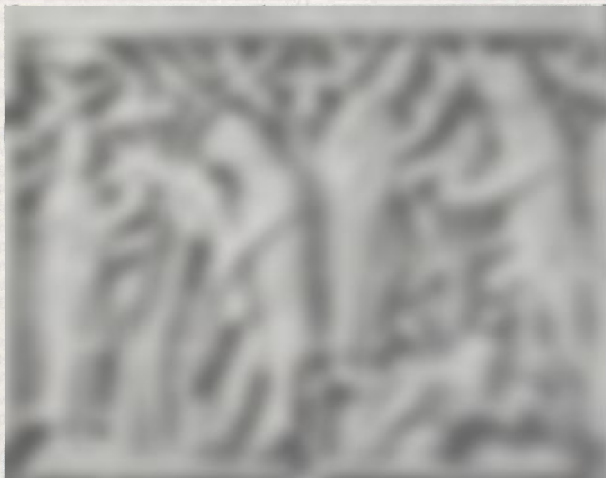
Gallus und der Bär, Ausschnitt aus einer Elfenbeintafel in der Stiftsbibliothek St. Gallen, um 900.

Das Audiovisuelle Archiv des Hauptstaatsarchivs Stuttgart kann einen neuen Service bieten. Im Rahmen des Kooperationsvertrags mit dem Süddeutschen Rundfunk, der die sendereigenen Tonträger mit Produktionen aus der Zeit von 1945 bis 1949 dem Audiovisuellen Archiv zum Kopieren zur Verfügung gestellt hat, kann die Geschichte der Nachkriegszeit anhand authentischer Tondokumente des Süddeutschen Rundfunks nun auch im Hauptstaatsarchiv von dessen Nutzern erforscht, beschrieben und dargestellt werden. Es ist vorgesehen, in gleicher Weise Tondokumente des Südwestfunks im Hauptstaatsarchiv zugänglich zu machen.