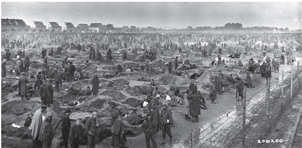
Wie hier im Lager Rheinberg wurden die gefangen genommenen deutschen Soldaten nach Kriegsende unter freiem Himmel und unter harten Bedingungen hinter Stacheldraht zusammengepfercht.

An der Hygiene mangelte es im Lager ebenfalls. Die improvisierten Latrinen, umfunktionierte Granatrichter, stanken und waren durch-