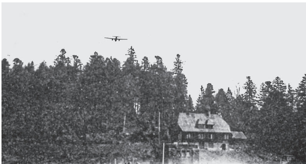
Ein deutsches Kampfflugzeug der Marke Dornier Do 17 beim Zieldarstellungsflug auf die Talsperre.

Zentrale bekam der Melder mündlich die Parole und die Nachtjägersignale mitgeteilt. Die Nachtjäger, also die deutschen Flugzeuge, die nachts gegen die einfliegenden britischen Bomber eingesetzt waren, schossen zu ihrer Erkennung Leuchtraketen über der Flakstellung ab. Diese leuchteten entweder blau-rot oder grün-gelb. 59 Außerdem wurden die LWH nachts zum Scheinwerferdienst verpflichtet. 60