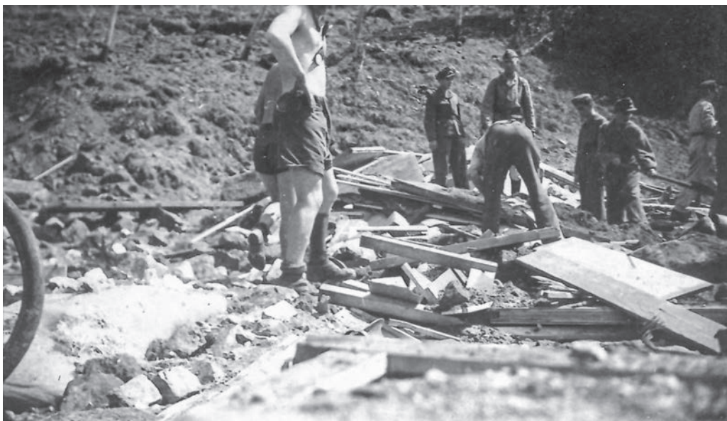
Aufräumarbeiten nach dem Angriff vom 19. Juli 1944.

Verpflegung erhielten die LWH regelmäßig mittags und abends. An den Nachmittagen wurden die LWH zum Essenholen für das Abendessen eingeteilt. 73 Zum Mittagessen gab es häufig