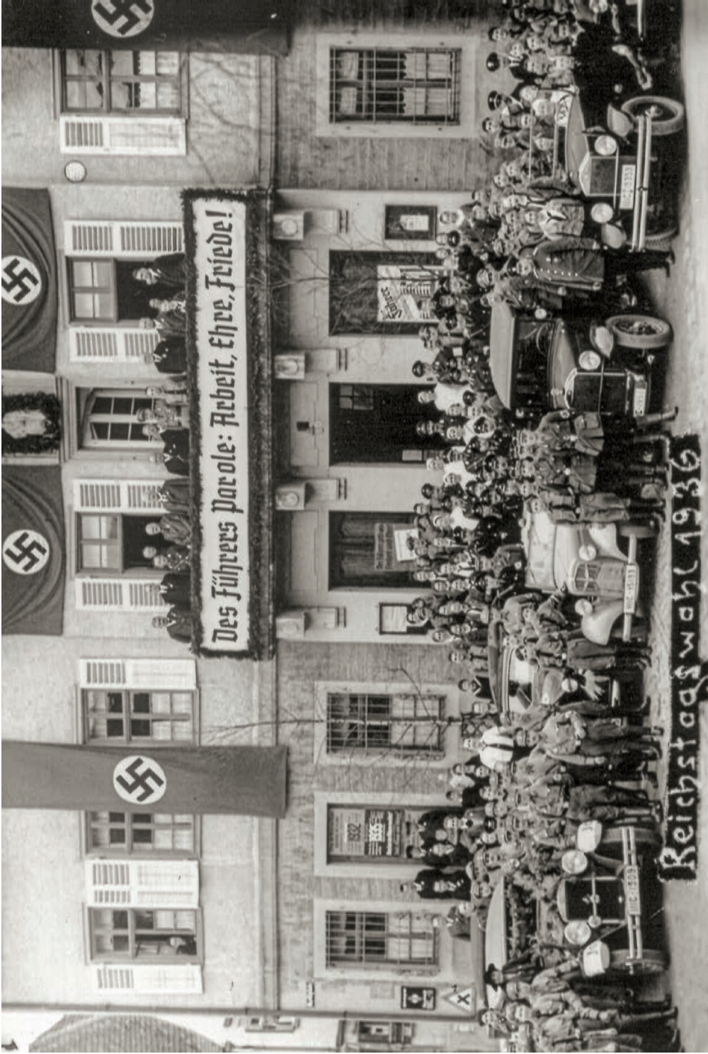
Vollversammlung vor dem Murrhardter Rathaus anlässlich der „Reichstagswahl“ von 1936.