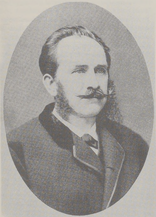
Der Crimmitschauer Arbeiterführer Julius Motteler.

Mit seiner leidenschaftlichen Überzeugungskraft half Julius Motteler 1867 August Bebel zur Wahl in den Norddeutschen Reichstag.