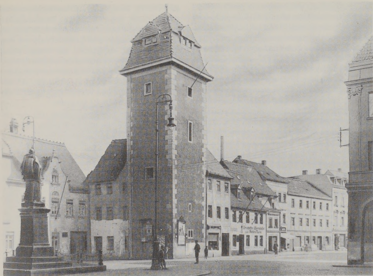
Der sogenannte „Rote Turm“ in Crimmitschau (um 1900).

Das noch existierende und 1586 errichtete Renaissance-Portal in der Herrengasse 1 zeugt unter anderem vom Reichtum der Stadt. Bis zum Dreißigjährigen Krieg war das Bierbrauen weit verbreitet. Die älteste Brauordnung der Stadt stammt aus dem Jahre 1575. So gab es 1614 in Crimmitschau 33 Malz- und 18 Brauhäuser. Mit dem Niedergang der Stadt während des Dreißigjährigen Krieges ließ auch das Bierbrauen stark nach. 1682 gab es in der Stadt lediglich noch zwei Brauhäuser. Während des Dreißigjährigen Krieges forderte die Pest 1630 und 1633 über 1000 Opfer in der Stadt. In den Jahren 1634, 1635 und 1639 wurde die Stadt mehrfach durch kaiserliche Truppen, teils auch durch schwedische Truppendurchzüge unter General Banér geplündert und gebrandschatzt. Aus dieser Zeit stammt die historische Legende, daß ein Melde-reiter in der Herrengasse durch scharfen Trab das Hufeisen seines Pferdes verlor. Es flog in den zweiten Stock hoch und blieb am Fensterbrett hängen. Dort kann man es heute noch hängen sehen.