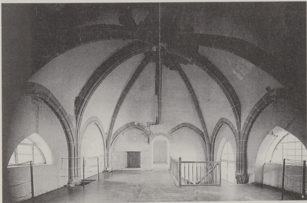
Das Gewölbe des gotischen Chores St. Michael im Backnanger Stadtturm, nach Westen.

Im folgenden interessieren uns die einzelnen Elemente des Chors, allen voran das neunstrahlige Rippengewölbe. Es geht hier nicht noch einmal allein um kunsthistorische Aspekte, da mir dieses Terrain auch zu fremd wäre; doch soll zu zeigen versucht werden, warum der gotische Chor St. Michael gerade in dieser Einmaligkeit gebaut wurde. Die Singularität der Anzahl von neun Gewölberippen führte beispielsweise zu der Vermutung, daß dieser Bauschritt aus statischen Gründen nötig geworden