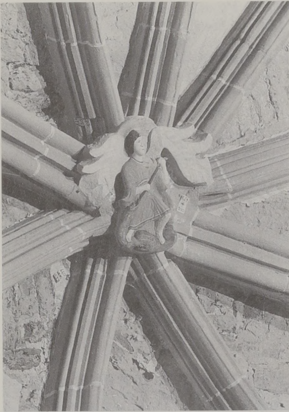
Der Gewölbeschlussstein des Chors St. Michael mit dem Patron der ehemaligen Kirche, der Erzengel Michael

war. 4 Dies kann an dieser Stelle nicht widerlegt, aber auch nicht bestätigt werden. Vielmehr zielt dieser Beitrag in eine andere Richtung.