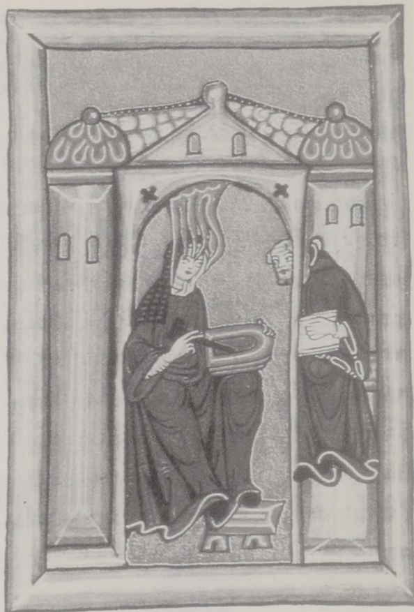
Hildegard von Bingen und ihr Sekretär Vollmar. Aus dem Rupertsberger Scivias, um 1165, fol. 1r.

Im Zentrum dieses neunstrahligen Himmelsgewölbes befindet sich Michael, der erste der Engel und erster Vermittler. Eingerahmt wird dieser Bedeutungsraum von fünf Mauern, den Sinnen des Menschen. Diese streben zum einen nach außen: in Nächstenliebe auf den Umkreis der Kirche, hinaus in die Welt mit all ihrer Unvollkommenheit. Zum anderen nach innen: in Gottesliebe hin zum innersten Gebot, das mit all der Sinnlichkeit nach der Erlangung des Gottesreiches, nach der Einheit von Zeitlichem und Ewigem verlangt. Die Zahl der fünf Mauern, die den Chor umschließen und die Zahl der neun Rippen, die den Chor überspannen, weisen auf die Unvollkommenheit hin, die noch besteht. Doch läßt die Kirche als Institution und auch als bedeutungstragendes Gebäude die Möglichkeit zu, diese Lücke in der Ordnung zu schließen: im Gottesdienst, in der Eucharistie, in der Kommunion, die an die Passion und Auferstehung erinnert. Des Menschen opus , sein selbst verantwortetes Handeln im Gebet und Gelübde nimmt seinen Ursprung im Altar, in der Gnade Gottes; es wird bewirkt durch des Menschen fünf Sinne und wird vermittelt durch die neun ordines angelorum mit ihrem Ersten. Weiter oben verkünden die Glocken des Menschen opus und Gottes Ruf dazu, sie läuten in den Alltag und in den Sonntag und ermuntern den Menschen „im Streben nach ewiger Belohnung, nach Reinhaltung des Glaubens, des Lei-