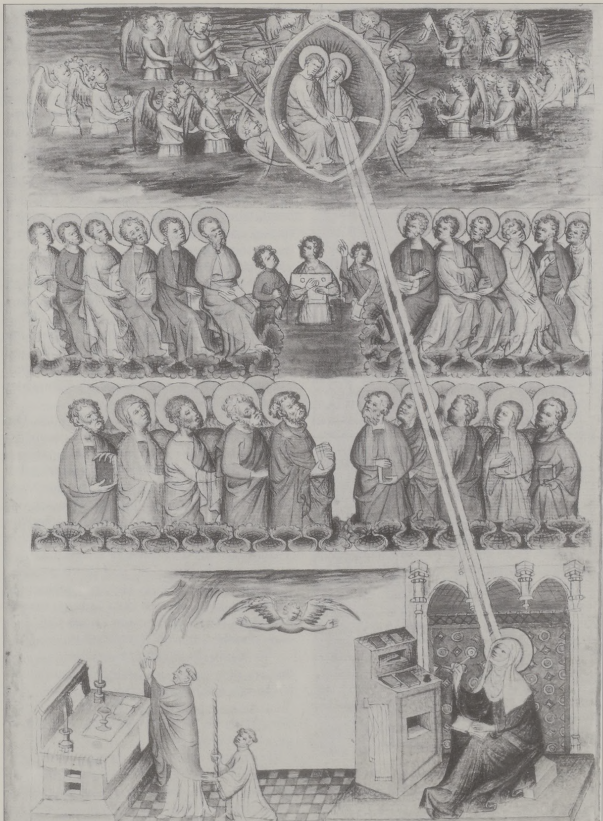
Die heilige Brigitta von Schweden (unten) empfängt eine Vision von Christus mit Maria zur Rechten auf dem Himmelsthron. Links und rechts davon sind die Engel dargestellt, eingeteilt in die drei Triaden; darunter die zwölf Apostel mit alttestamentarischen Personen, darunter Märtyrer und Heilige. Aus der Eric'sberghandschrift (erste Hälfte des 15. Jahrhunderts).