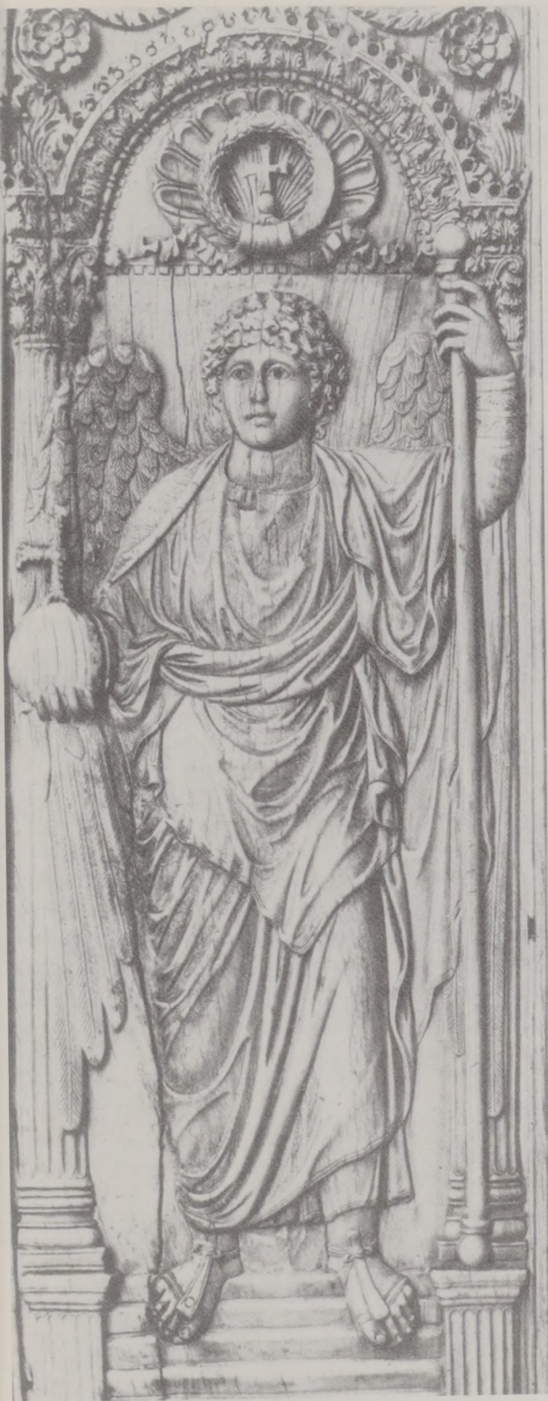
Michael als göttlicher Reichsherold und Wächter des Himmels. Byzantisches Elfenbeinrelief, 6. Jahrhundert.

schung schon hingewiesen. 21 Demnach bekämpft er einen Drachen, den er mit Hilfe des Blut des Lammes, also aufgrund der Erlösungstat Christi am Kreuz, besiegen kann (Offb. 12,7–11). Michael fungiert in diesem Kampf gegen den Drachen als Anführer der Engel, als Engelfürst. Weitere Bibelstellen belegen diese Rolle (Dan. 10,13.21 und 12,1; Jud. 9). Das Mittelalter nahm die Einteilung der Engel in einer Hierarchie an. Eine Analogie an militärische Strukturen drängt sich auf: Michael wird nicht wie andere Engel (Gabriel, Raphael) beschrieben, sondern erhält explizit ein kriegerisches und kämpferisches Attribut. Inwieweit in diesem Zusammenhang mit Krieg eine gewalttätige Auseinandersetzung gemeint ist, sei dahingestellt; doch zweifelsohne kämpft Michael gegen böse Mächte, die sich dem Reich Gottes entgegenstellen: so in der Offenbarung des Johannes gegen den Drachen, der sich vor eine gebärende Frau stellt, um ihr Kind gleich nach der Geburt zu verschlingen. Zudem wird Michael eindeutig als Führer des Engelheeres beschrieben. 22