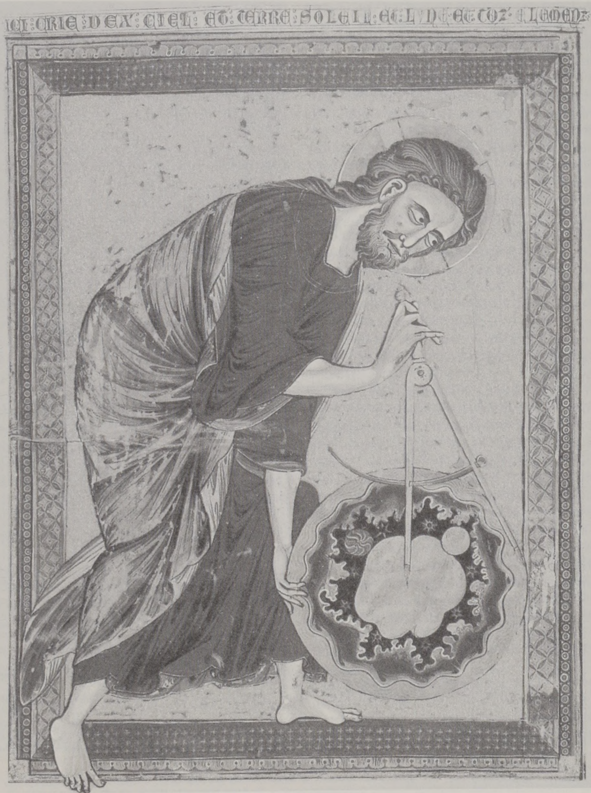
Gott als Schöpfer, der die Welt mit dem Zirkel und Zahlengesetzen folgend entwirft. Fol. 1v der Bible moralisée (Wien) aus der ersten Hälfte des 13. Jahrhunderts.

nis der Dimensionen untereinander. Doch wird auch nach der Anzahl von Gegenständen, von Elementen, von Teilen des Kirchenbaus gefragt, und es wird versucht, diese zu deuten. Die