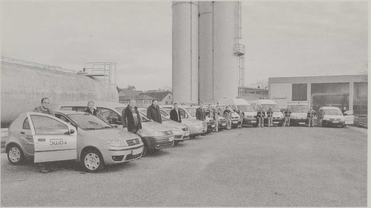
Die Fahrzeugflotte der Stadtwerke Backnang wird inzwischen auch durch das umweltfreundliche Erdgas angetrieben.