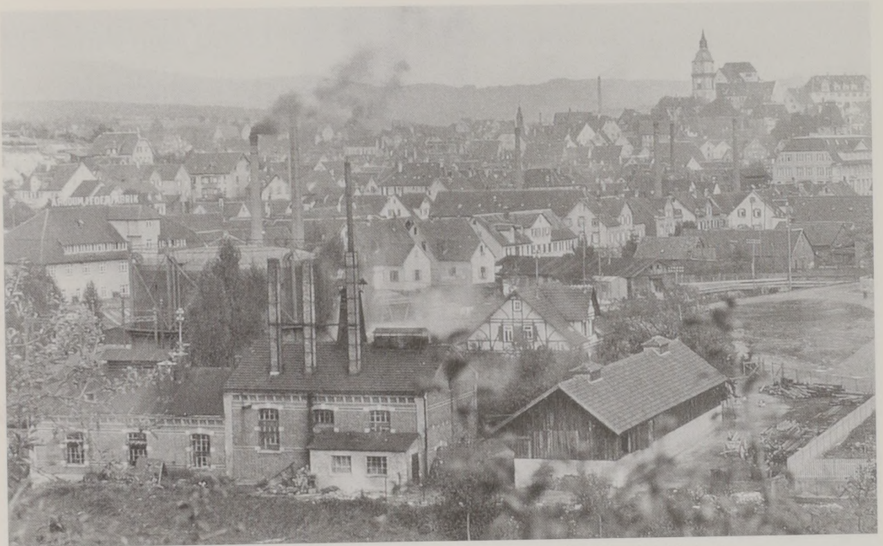
Blick von der Schöntaler Höhe auf das Gaswerk (Aufnahme Ende Erster Weltkrieg).

nung zu und bot einen Erdgasanschluss für die Versorgung Backnangs an, der dann ein Jahr später verwirklicht wurde. Damit konnten sich die Stadtwerke von der seither praktizierten Insellösung verabschieden und nun das umweltfreundliche Erdgas verbreiten. Mit Unterstützung der Technischen Werke Stuttgart (TWS) wurde am 26. April 1982 mit dem Bau der 4,5 Kilometer langen Hochdrucktransportleitungen von der Übergabestelle in Heiningen begonnen. Der Erdgasbetrieb wurde dann am 4. Oktober 1982 mit der Geräteumstellung aufgenommen, wobei insgesamt 4125 Gasgeräte innerhalb von 15 Arbeitstagen auf Erdgasbetrieb umgestellt wurden – eine große strategische Leistung innerhalb kürzester Zeit. Im Lauf der Jahre wurden nun nicht nur die Leitungsnetze in Backnang ständig erneuert und erweitert, sondern auch andere Orte im Raum Backnang mit Erdgas versorgt: Weissach im Tal, Kirchberg an der Murr (beide 1983), Auenwald (1985), Allmersbach im Tal (1990) und Aspach (1993). Das Gasleitungsnetz der Stadtwerke Backnang umfasst heute etwa 173 Kilometer und wird auch in Zukunft ständig vergrößert werden.