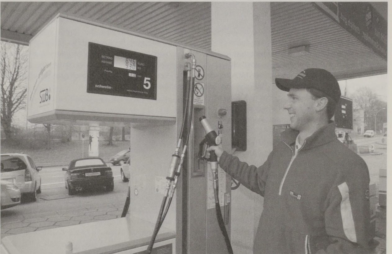
Erdgastanksäule in der Aspacher Straße.