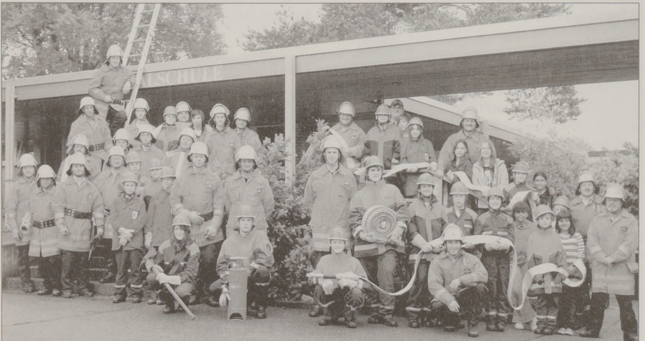
Die FFW Backnang-Waldrems im Jubiläumsjahr.