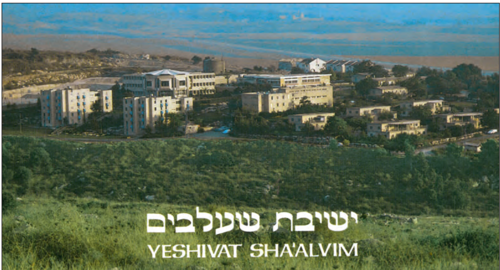
Die Schule Yeshivat mit Synagoge in Sha'alvim.