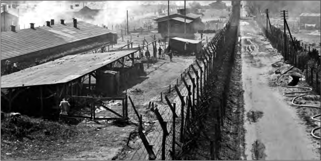
Ein Teil des Konzentrationslagers Bergen-Belsen kurz nach der Befreiung durch die britische Armee am 15. April 1945.