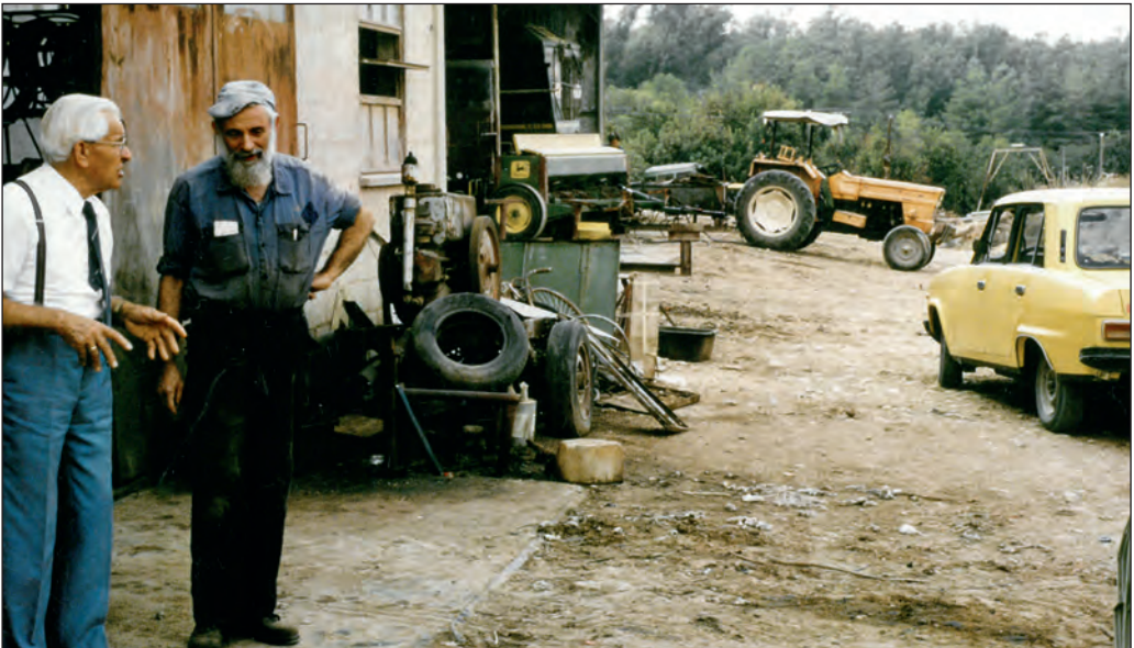
Landwirtschaft im Kibbuz mit einfachen Mitteln. Ein aus Frankfurt stammender Jude gibt Matthäus Informationen.