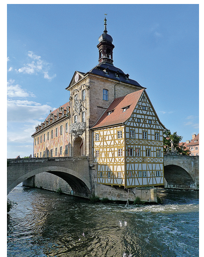
Links: E.T.A. Hoffmanns erste Wohnung nach der Ankunft in Bamberg. Rechts: Das Bamberger Rathaus