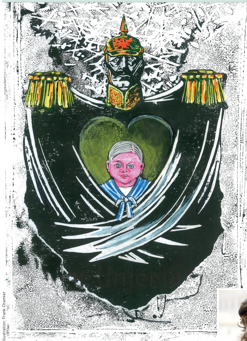
Illustration: Frank Chamier