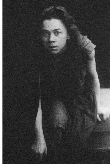
Gertrud Eysoldt als Puck, 1905, als Lulu, 1902, und als Elektra, 1903