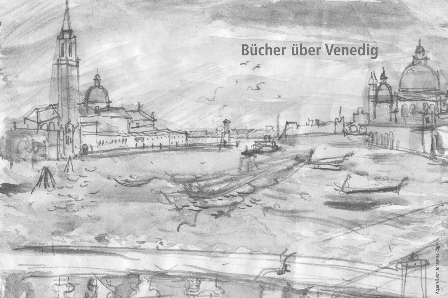
Aquarell von Johannes Röger