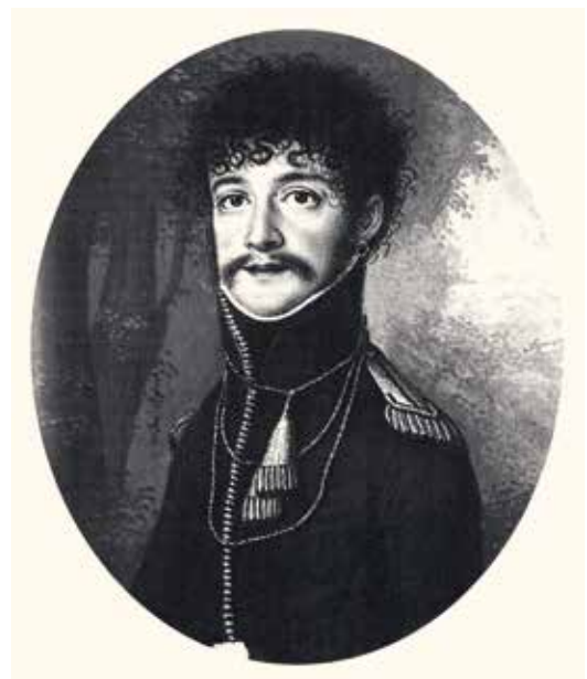
Boris Johnson | Prinz Paul Friedrich Karl August von Württemberg (1785–1852)